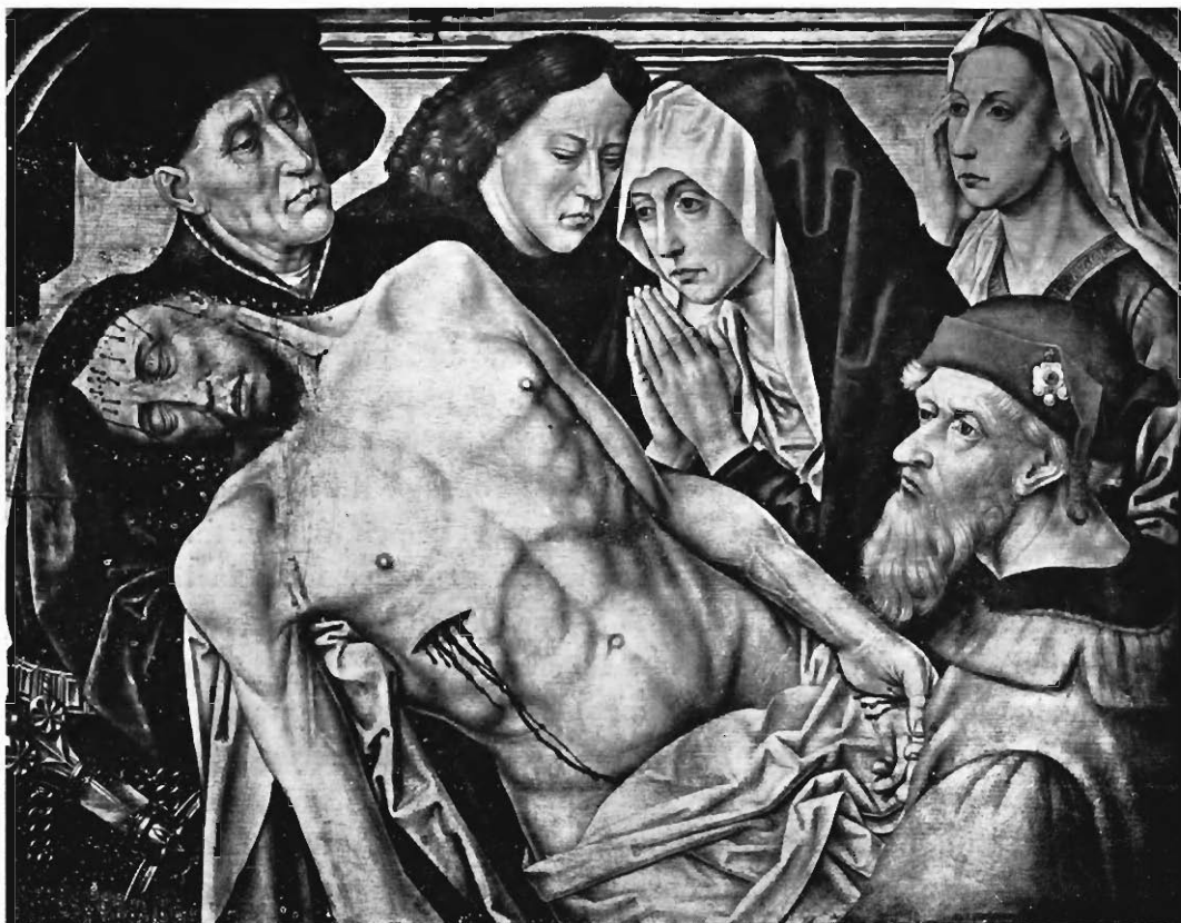
Fig. 2. — LA MISE AU TOMBEAU. — Copie d'après Hugo Van der Goes. (Musée National de Naples).

pour faire tisser semblable composition. Il suffisait de s'adresser à des artistes de Bruxelles, de Bruges, ou mieux encore, puisqu'il s'agit de Tournai, à des