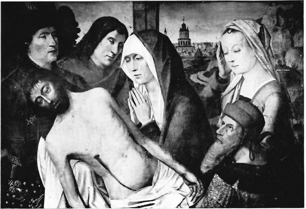
Fig. 1. — LA MISE AU TOMBEAU. — Interprétation française; xvr siècle.

les analogies qui existent entre la tête de Marie-Madeleine et cette même sainte dans le triptyque des Portinari du Musée des Offices à Florence et