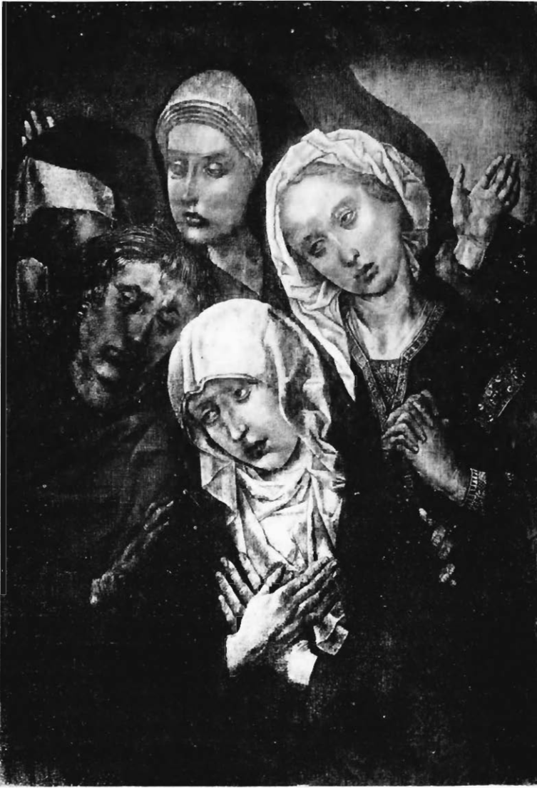
Fig. 5 — MISE AU TOMBEAU. Fragment de peinture à la détrempe. (Musée de Berlin).

Ces faiblesses d'interprétation se comprennent d'ailleurs sans peine si on se rend compte de la science que décèlent le dessin et le modelé du morceau