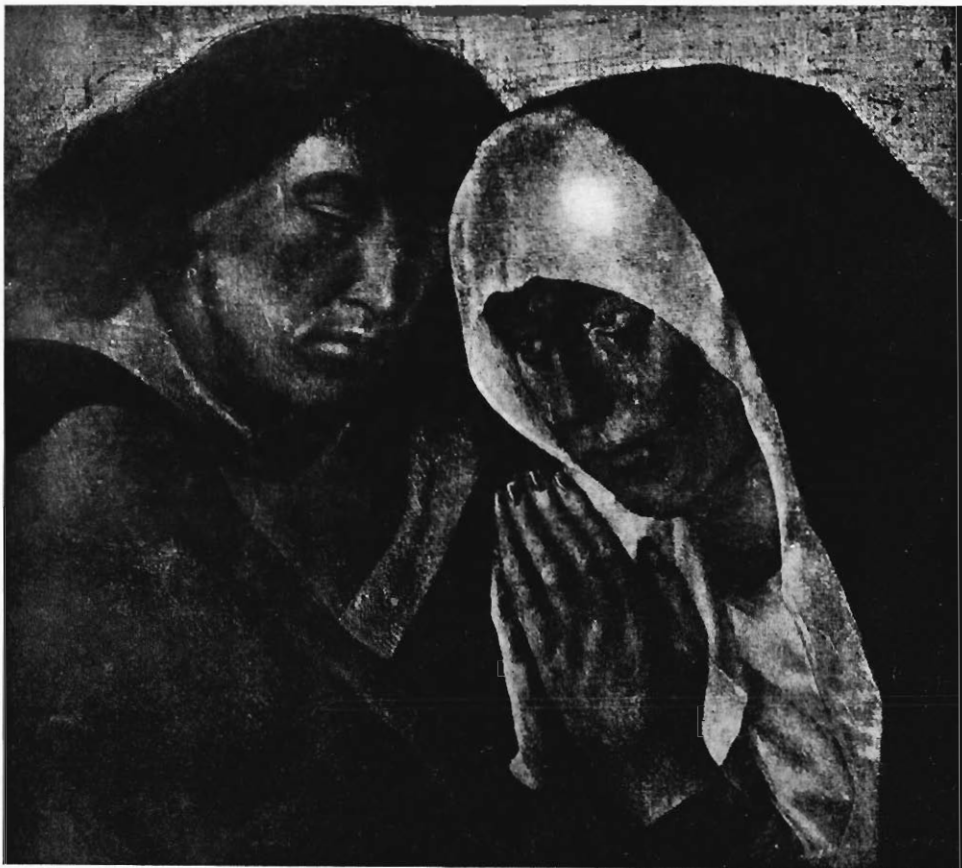
Fig. 1. — FRAGMENT DE PEINTURE A LA DÉTREMPE. (Appartenant à la Librairie du Christ-Church, d'Oxford.)