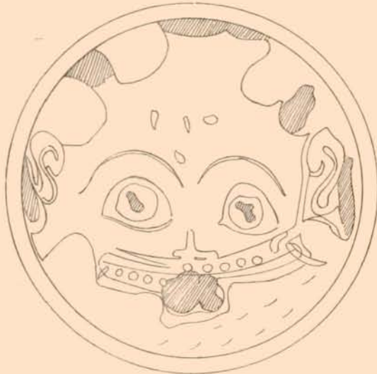
FIG. 7. — GORGONÉION PEINT À L'INTÉRIEUR DE LA COUPE DUTUIT.