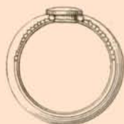
FIG. 5. — BAGUE D'OR DE TRAVAIL IONIEN, AU MUSÉE BRITANNIQUE.

Journal of hell. studies , XIII, pp. 256 sqq., and De Ridder, De ectypis , pp. 22-3. My opinion is that the strips of bronze had been attached to a wooden larnax and that in a general way they represent the bands of design in the larnax of Cypselus. The date would be about the end of the 7 th cent. B. C., I suppose. Among the fragments, we obtained several large rosettes of very thin bronze which had been fastened on to the larnax; you will see the remains of one of these rosettes still fastened over the hippalectryon.»