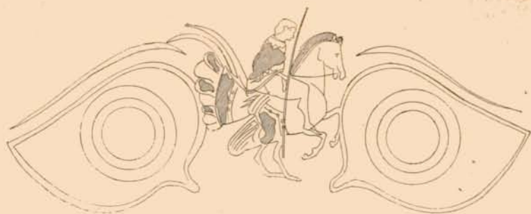
FIG. 1. — COUPE DUTUIT (motif extérieur).