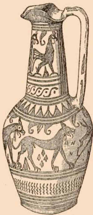
FIG. 3. — CRUCHE DU PHALÈRE, AU MUSÉE BRITANNIQUE; hauteur, 0 m 17; d'après Böhlau, Frühalt. Vasen , fig. 8 ( Jahrbuch , II, p. 48).

Cette explication a été généralement contestée. Je ne puis pourtant pas me résoudre à voir une simple scène de genre, eine harmlose Genrescene 2 , dans la peinture en question. Pour les contradicteurs de M. Löscheke, l'éphèbe aux coqs s'amuse avec ses animaux favoris, — comme, sur les stèles d'Orchomène, de Naples et d'Apollonie, on voit un homme s'amuser à agacer son chien. Mais pourquoi cet éphèbe n'aurait-il dans son chenil que des chiennes? Que fait autour de lui toute cette basse-cour? Basse-cour étrange, car à côté de coqs ordinaires il s'en trouve de taille gigantesque et fantastique. Les contradicteurs de M. Löscheke paraissent n'avoir raisonné que sur le dessin qu'il avait publié, et qui est reproduit dans le Lexicon de Roscher, II, 1128 : c'est un extrait qui ne donne que le groupe central, l'éphèbe entre les chiennes. — Au reste, la meilleure façon de corroborer l'interprétation de M. Löscheke, c'est de