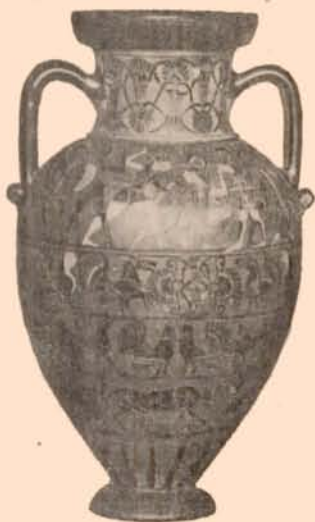
FIG. 6. — AMPHORE ATTICO-IONIENNE, AU MUSÉE UNIVERSITAIRE DE BONN.

10. Amphore de Munich (ancienne coll. Candelori; mentionnée par Gerhard, Rapporto Volcente , n° 598; Jahn, 86), à figures noires. D'un côté,