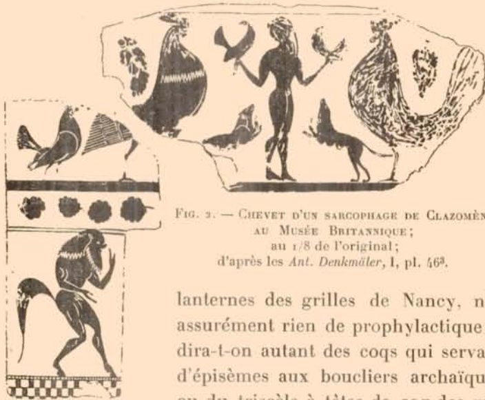
FIG. 2. — CHEVET D'UN SARCOPHAGE DE CLAZOMÈNES, AU MUSÉE BRITANNIQUE; au 1/8 de l'original; d'après les Ant. Denkmäler , I, pl. 46 b .

La prédilection de l'art grec archaïque pour les ζῳδια doit s'expliquer en partie par des croyances superstitieuses; l'usage de décorer les caveaux et monuments funéraires de ζῳδια prophylactiques est attesté pour toute l'Antiquité 1 . En tout cas, si le coq a été l'un des ζῳδια préférés des archaïques, le fait paraît tenir surtout aux superstitions dont cet oiseau était l'objet. Les coqs de Jean Lamour, qui tiennent dans leur bec les