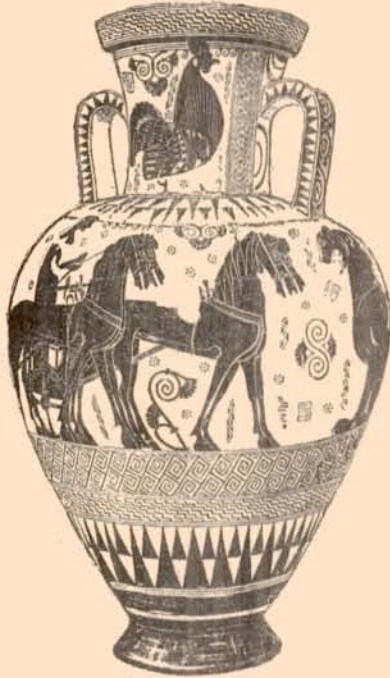
FIG. 4. — AMPHORE FUNÉRAIRE, ATTICO-IONIENNE, AU MUSÉE D'ATHÈNES; hauteur, 1 m 10; d'après l'Εφγμ. ἀρχ., 1897, pl. 5.

Sur la cruche du Phalère ( fig. 3 ), qui est jusqu'ici le plus ancien vase grec où le coq soit représenté 1 , notre oiseau n'a peut-