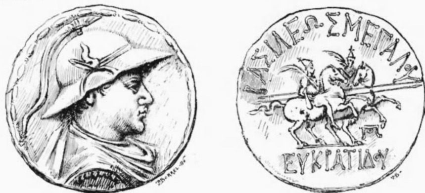
MONNAIE EN ARGENT D'EUCRATIDÈS, ROI DE BACTRIANE.

On a rapporté une partie du revêtement en bronze des portes extérieures du palais d'Artaxerxès 1 , une intéressante collection de statuettes de bronze, de terre-cuite, de marbre et d'ivoire, des urnes funéraires, des armes et des objets de toilette, enfin, une série d'inscriptions cunéiformes gravées sur des briques. Tous ces objets seront disposés dans des vitrines au centre de la grande salle du premier étage.