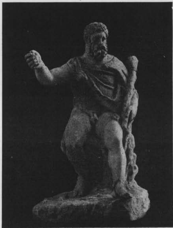
Fig. 1. — Statuette d'Héraklès.

luxueux volumes in-folio contenant les gravures de 74 statues restaurées par lui et dont 29 étaient destinées à l'Angleterre, 20 à la Prusse. « C'était, dit Clarac ( Musée , t. III, p. 306), un fort adroit, mais terrible restaurateur. » Le groupe d'Héraklès avec Cerbère est reproduit sur la planche XLI du tome I er . Clarac