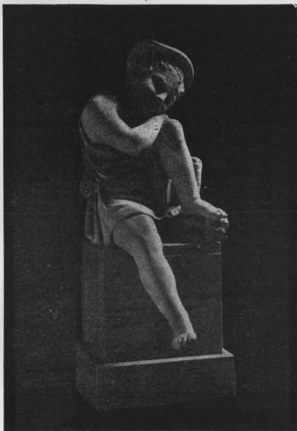
Fig. 2. — Statuette de jeune pêcheur.

dessin du Musée de Clarac d'après Cavaceppi semble démontrer que le Cerbère, ajouté par le restaurateur italien, a été enlevé par la suite et que nous pouvons augmenter d'une unité la liste