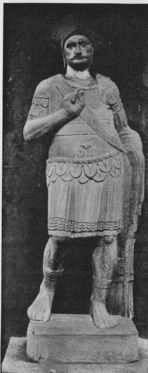
Fig. 4. — Guerrier de Cilli.