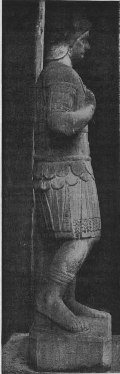
Fig. 5. — Guerrier de Cilli.