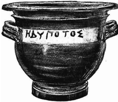
FIG. 1.—VASE AUS DER SAMMLUNG CAMPANA.

Das zweite Gefäß ist im östlichen Lokris, vermutlich in der Nähe von Ἀταλάντη gefunden worden (Fig. 2). Es ist 0.05 m. hoch und hat einen Durchmesser von 0.105 m.; es ist wie das erstgenannte schwarz gefirnisst, aber die Inschrift ΗΔΥΠΟΤΟΣ \Xi ist diesmal, ebenso wie die horizontalen Linien darüber und darunter mit gewandter und sicherer Hand eingeritzt.