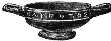
FIG. 2.—VASE AUS LOKRIS.

habe. Erwähnt wird das Gefäß auch von Hesychios s. v. und von Pollux, VI, 96, vor allem aber kommt es häufig in den Schatzverzeichnissen griechischer Heiligtümer vor. 1 Zu ἡδυποτίς wird man sich wol ebenso gut κύλιξ ergänzen wie zu ἡδύποτος, und in den delischen Inschriften wird eine ἡδυποτίς wirklich auch als κύλιξ bezeichnet, 2 zufälliger Weise dasselbe Weihgeschenk der Echenike, welches uns schon aus Athenaios bekannt war. Die ἡδύποτος aus Lokris entspricht ja auch im Wesentlichen der bekannten, sogar inschriftlich gesicherten 3 Form der Kylix, ohne allerdings die Eleganz der attischen Schalen zu erreichen, die Vase Campana würde dagegen wol niemand von selbst dem