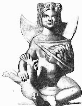
Рис. 3. Статуетка изъ Меоніи.

изъ Меоніи (рис. 3) 1) . Находящійся за плечами полумѣсяцъ не допускаетъ никакихъ сомнѣній относительно значенія этой фигуры. Изображеніе бога въ юномъ возрастѣ сближаетъ эту терракоту съ ниже издаваемыми изображеніями Мѣсяца ѣдущимъ на пѣтухѣ, а также съ изображеніями эротовъ александрійскихъ и римскихъ временъ, александрійскаго Ариократа и т. п. Изображенія Мѣсяца юнымъ, даже младенцемъ вполне уместны, если вспомнить, какое значеніе имѣло въ его культѣ „рожденіе мѣсяца“ (μορτησία II, 38). Богъ на меонійской