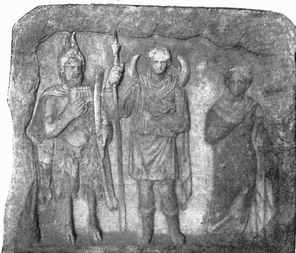
Рис. 1. Рельефъ Аонскаго Центрального Музея № 1444.

Общества (№ по инвентарю 3826). Высота рельефа 0,41, ширина 0,43. Происходить этотъ рельефъ, какъ намъ любезно сообщилъ г. Вольтерсъ, откуда-то изъ окрестностей Аонии 1) . На рельефѣ представленъ Мѣсяцъ въ гротѣ Пана; это даетъ возможность предполагать, что издаваемый рельефъ находился пѣкогда въ числѣ иныхъ votivныхъ релье-