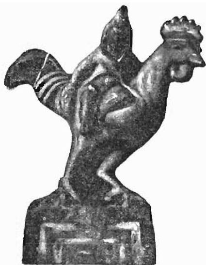
Рис. 5. Керченская статуэтка.

чика, бокомъ сидящаго на пѣтухѣ (рис. 5) 1) . Въ правой рукѣ онъ держитъ виноградную гроздь, лѣвой держится за шею пѣтуха; на головѣ высочій колпакъ, очевидно, фивійскій; на плечахъ плащъ, застегнутый на груди и оставляющій непокрытою нижнюю часть тѣла; небрежность работы не позволяетъ разобрать точно одежду. На клювѣ и ногахъ пѣтуха видны слѣды голубой краски. Обнаженность нижней части тѣла на керченской статуэткѣ, хотя и напоминаетъ изображенія Аттиса, по объ-