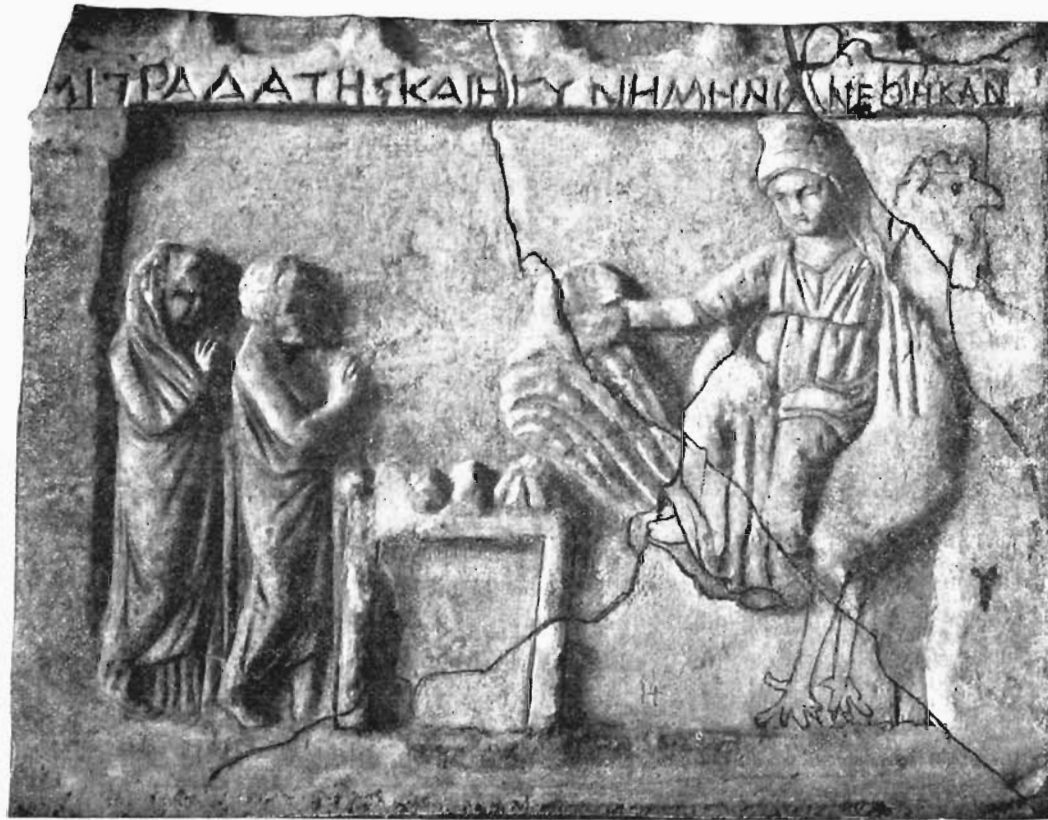
Рис. 4. Рельефъ Аѳинскаго Центрального Музея № 1406.

28. Рельефъ Аѳинскаго Центрального Музея (№ 1406), найденный въ Тѳорикѣ, въ Атикѣ, и суди по надписи, на немъ находящейся