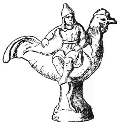
Рис. 6. Терракотта въ Музеѣ въ Карлсруэ.

30. Изображеніе Мѣсяца же, по аналогіи съ аттическимъ рельефомъ, видимъ мы въ терракотѣ музея въ Карлсруэ (рис. 6), пронсходящей, быть можетъ, изъ Сициліи или южной Италіи 1) . Богъ представленъ сидящимъ бокомъ на пѣтухѣ. На немъ рубашка и высокая шапка; правою рукою придерживаетъ ошь птвицу, новидному, также пѣтуха,