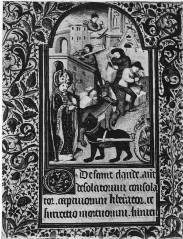
SAINT CLAUDE CONSTRUISANT LA CATHÉDRALE DE BESANÇON. Miniature du ms. 164 de la Bibliothèque de Manchester.

En 823, saint Modeste, moine de Saint-Gall, est calligraphe et miniaturiste. Il nous a légué son portrait, conversant avec son confrère