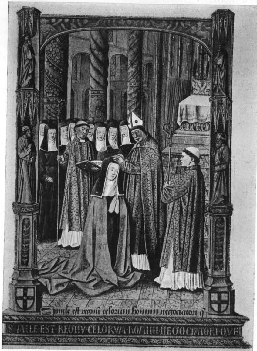
JEANNE DE VALOIS DANS SA CHAPELLE DE L'ANNONCIADE, A BOURGES.

de Vulcop seraient, d'après Grandmaison, les plus anciens des artistes