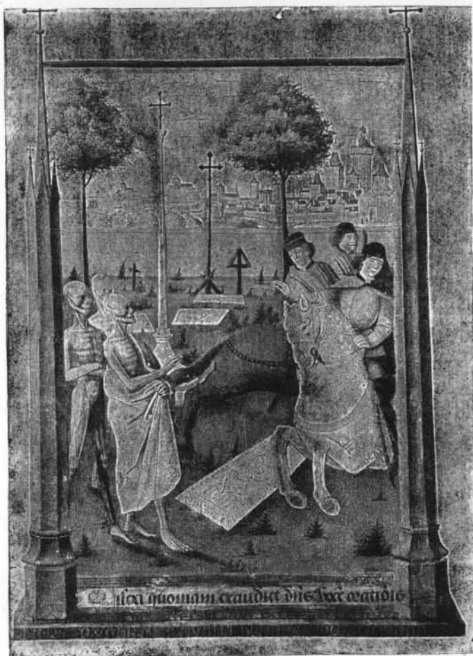
LES TROIS MORTS ET LES TROIS VIFS.