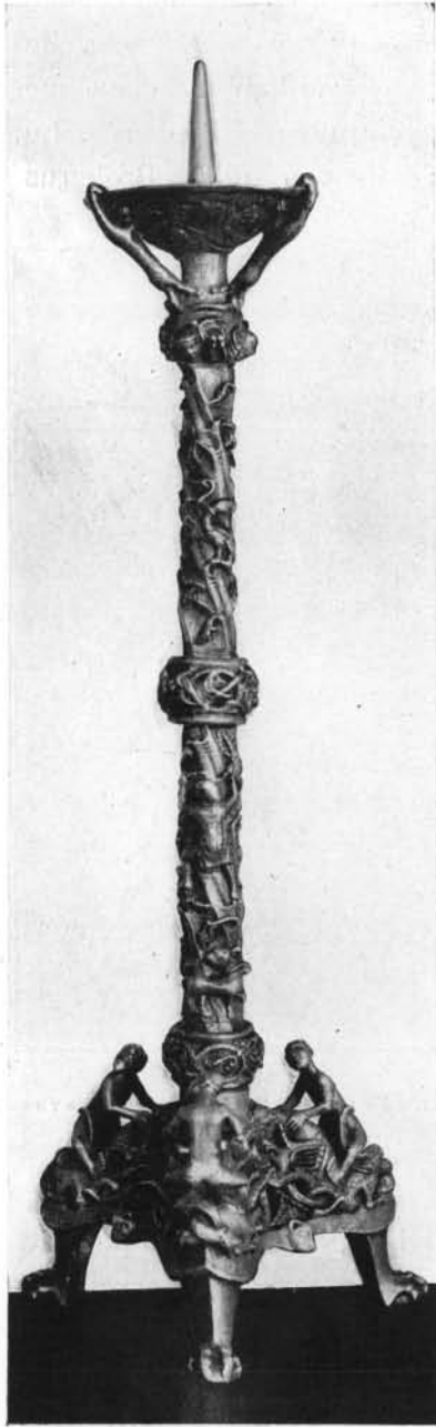
FLAMBEAU DE BRONZE EXÉCUTÉ ET SIGNÉ PAR SAINT BERNWARD, ÉVÊQUE D'HILDESHEIM.

Passavant (1143-1187), qui connaissait la sculpture et même l'émaillerie,