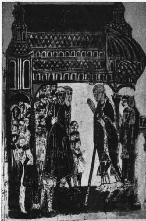
LE VÉNÉRABLE FULBERT, ÉVÊQUE DE CHARTRES, SOUS LE PORCHE DE SA CATHÉDRALE.