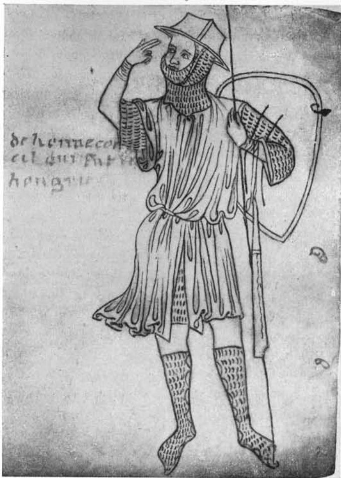
VILLARD DE HONNECOURT.

Mais voilà que tout se transforme : Philippe III crée des nobles personnels ; les premières lettres sont de 1270. Or, quel en est le premier bénéficiaire ? Un artiste, Raoul, l'orfèvre du Roi, descendant de Bonnard,