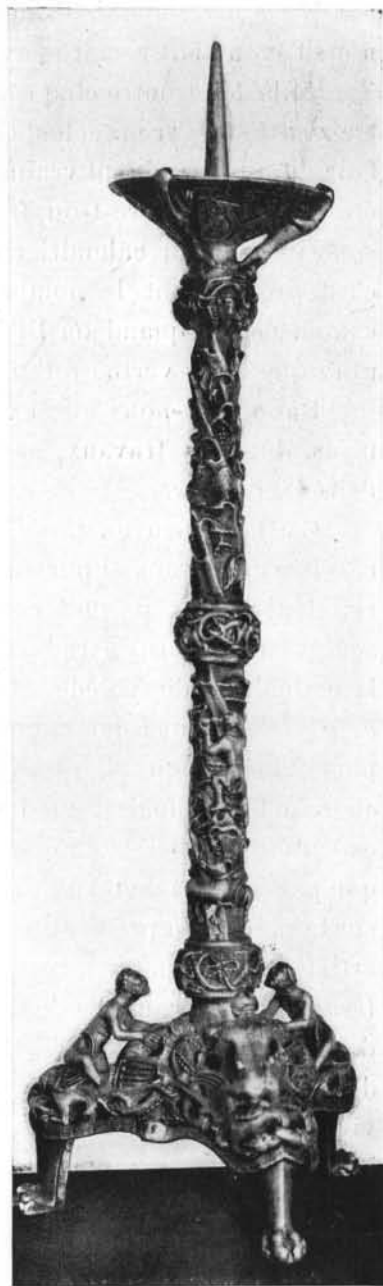
FLAMBEAU DE BRONZE EXÉCUTÉ ET SIGNÉ PAR SAINT BERNWARD, EVÊQUE D'HILDESHEIM.

Nous ne tardons pas à rencontrer une autre précision aussi catégorique. En 1176, un petit berger d'Alvillard, nommé Benoît, reçut de Dieu l'ordre d'aller construire un pont sur le Rhône, à Avignon. Quand il se présenta devant l'évêque, devant les officiers municipaux, il fut l'objet de la risée générale ; mais le peuple prit parti pour lui, et le pont, aussitôt commencé, était terminé en 1188. Comme il ne pouvait être que l'effet d'un miracle, le petit architecte, mort très jeune, fut canonisé sous le nom de Bénézet. Ce ne sont certes pas ses vertus laïques, mais bien son talent d'architecte, qui le firent inscrire ainsi au Martyrologe .