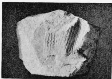
Abb. 1. Fragment D.

Grösste Höhe noch 0,40, grösste Breite noch 0,34 m. Litteratur: v. Sybel Katalog der Sculpturen zu Athen 5042; Milchhöfer Archäol. Zeitung 1883 S. 181. Fundort unbekannt.