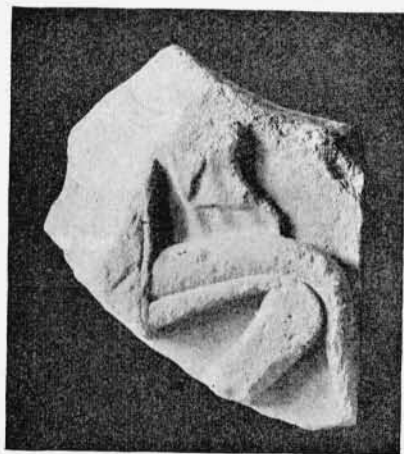
Abb. 2. Fragment E.

Lechat a. a. O. nennt von diesen Stücken nur A B C und fügt irrtümlich die auf Photogr. des Instituts Akropolis Nr. 165 vereinigten Bruchstücke hinzu, welche von zwei kleinen Votivreliefs stammen.