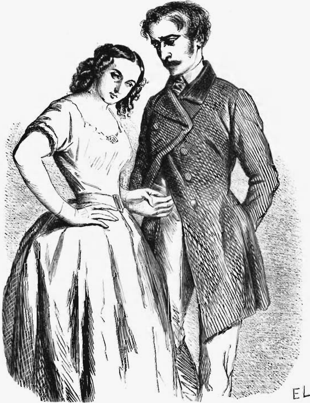
Une goutte d'eau dans le désert, et... par la main d'un ange!... — PAGE 50.

tière. Il s'apostrophait d'autant plus en lui-même, qu'il se trouvait aux prises avec la plus aigüe de toutes les misères, une misère cachée. Il était, comme toutes les natures essentiellement vaniteuses et légères, sujet à ce singulier point d'honneur qui consiste à ne pas déchoir aux yeux de son public, qui fait commettre des crimes légaux aux hommes de Bourse pour ne pas être chassés du temple de l'agiotage, qui donne à certains criminels le courage de faire des actes de vertu. Lousteau dinait et déjeunait, fumait comme s'il était riche. Il n'eût pas, pour une succession, manqué d'acheter les cigares les plus chers, pour lui, comme pour le dramaturge ou le prosateur avec lesquels il entrait dans un débit. Le journaliste se promenait en bottes vernies; mais il craignait des saisies, qui, selon l'expression des huissiers, avaient reçu tous les sacrements. Fanny Beaupré ne possédait plus rien d'engageable, et ses appointements étaient frappés d'oppositions! Après avoir épuisé le chiffre possible des avances aux revues, aux journaux