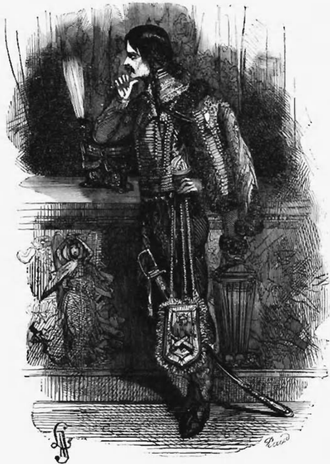
L'affaissement de ses membres et l'immobilité de son front accusaient toute sa douleur. — PAGE 57.

éclat factice de ce carmin foncé, ses yeux n'en étaient que plus ternes. Elle portait une grande quantité de diamants, et s'habillait avec assez de goût pour ne pas prêter au ridicule. Son nez pointu annonçait l'épigramme. Un râtelier bien mis conservait à sa bouche une grimace d'ironie qui rappelait celle de Voltaire. Cependant l'exquise politesse de ses manières adoucissait si bien la tournure malicieuse de ses idées, qu'on ne pouvait l'accuser de méchanceté. Les yeux gris de la vieille dame s'animent, un regard triomphal accompagné d'un sourire qui disait : — Je vous l'avais bien promis! traversa le salon,