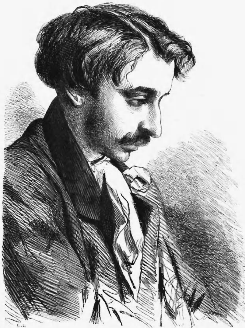
La veille, le vendredi, le malheureux, malgré son habitude de la misère... — PAGE 50.

Le dévoué magistrat, soutenu dans son œuvre par la mère et par le curé de la paroisse, était admirable en expédients. Il servait chaque mercredi quelque célébrité d'Allemagne, d'Angleterre, d'Italie ou de Prusse à sa chère comtesse; il la donnait pour une femme hors ligne à des gens auxquels elle ne disait pas deux mots; mais qu'elle écoutait avec une si profonde attention, qu'ils s'en allaient convaincus de sa supériorité. Dinah vainquit à Paris par le silence, comme à San-