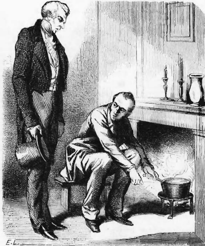
Je suis M. des Lupcaux, maître des requêtes, secrétaire général du ministère, et... — PAGE 15.

sont aggravées d'une troisième et terrible infériorité qui contribue à rendre cette figure sèche et sombre, à la rétrécir, à l'amoinrir, à la grimer fatalement. L'une des plus agréables flatteuses que les femmes s'adressent à elles-mêmes n'est-elle pas la certitude d'être pour quelque chose dans la vie d'un homme supérieur choisi par elles en connaissance de cause, comme pour prendre leur revanche du mariage où leurs goûts ont été peu consultés? Or, en province, s'il n'y a point de supériorité chez les maris, il en existe encore moins chez les célibataires. Aussi, quand la femme de province commet sa petite faute, s'est-elle toujours éprise d'un prétendu bel homme ou d'un dandy indigène, d'un garçon qui porte des gants, qui passe pour savoir monter à cheval; mais, au fond de son cœur, elle sait que ses vœux poursuivent un lieu commun plus ou moins bien vêtu. Dinah fut préservée de ce danger par l'idée qu'on lui avait donnée de sa supériorité. Elle n'eût pas été, pendant les premiers jours de son mariage, aussi bien gardée qu'elle le fut par sa mère, dont la présence ne lui fut importune qu'au moment où elle eut intérêt à l'écartier, elle aurait été gardée par son orgueil, et par la hauteur à la-