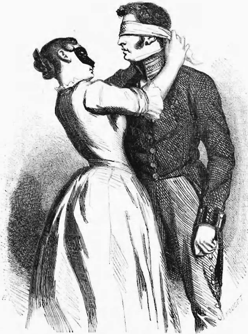
Elle me serra sur les yeux un mouchoir qu'elle noua fortement derrière ma tête. — PAGE 26.

des Français, volontiers, colonel Hulot. Il y a six jours, je revenais tranquillement à mon logis, vers onze heures du soir, après avoir quitté le général Montcornet, dont l'hôtel se trouve à quelques pas du mien. Nous sortions tous les deux de chez l'ordonnateur en chef, où nous avions fait une bouillotte assez animée. Tout à coup, au coin d'une petite rue, deux inconnus, ou plutôt deux diables, se jetèrent sur moi, m'entortillèrent la tête et les bras dans un grand manteau. Je criai, vous devez me croire, comme un chien fouetté ; mais le drap étouffait ma voix, et je fus transporté dans une voiture avec la plus rapide dextérité. Lorsque mes deux compagnons me débarrassèrent du manteau, j'entendis ces désolantes paroles prononcées par une voix de femme, en mauvais français : — Si vous criez, ou si vous faites mine de vous échapper, si vous vous permettez le moindre geste équivoque, le monsieur qui est devant vous est capable de vous poignarder sans scrupule. Tenez-vous donc tranquille. Maintenant je