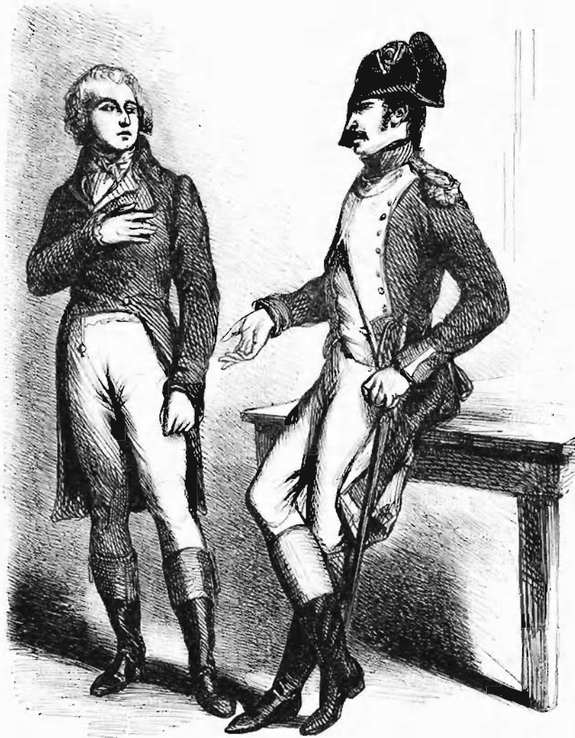
Il lui proposa d'être à l'Escharpe sur parole. — PAGE 25.

voici, répondit le geôlier en lui jetant une corde à nœuds. Elle a été fabriquée avec du linge afin de faire supposer que vous l'avez confectionnée vous-même, et elle est de longueur suffisante. Quand vous serez au dernier nœud, laissez-vous couler tout doucement, le reste est votre affaire. Vous trouverez probablement dans les environs une voiture tout attelée et des amis qui vous attendent. Mais je ne sais rien, moi ! Je n'ai pas besoin de vous dire qu'il y a une sentinelle au dret de la tour. Vous saurez bien choisir une nuit noire, et guetter le moment où le soldat de faction dormira. Vous risquerez peut-être d'attraper un coup de fusil ; mais... — C'est bon ! c'est bon ! je ne pourrai pas ici ! s'écria le chevalier. — Ah ! ça se pourrait bien tout de même, répliqua le geôlier d'un air bête. Beauvoir prit cela pour une de ces réflexions maïses que font ces gens-là. L'espoir d'être bientôt libre le rendait si joyeux, qu'il ne pouvait guère s'arrêter aux discours de cet homme, espèce de paysan renforcé. Il se mit à l'ou-