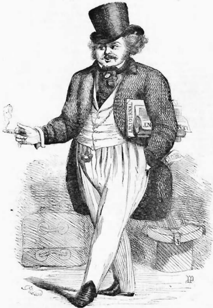
Chacun de dire en le voyant : — Ah! voilà l'illustre Gaudissart! — PAGE 2.