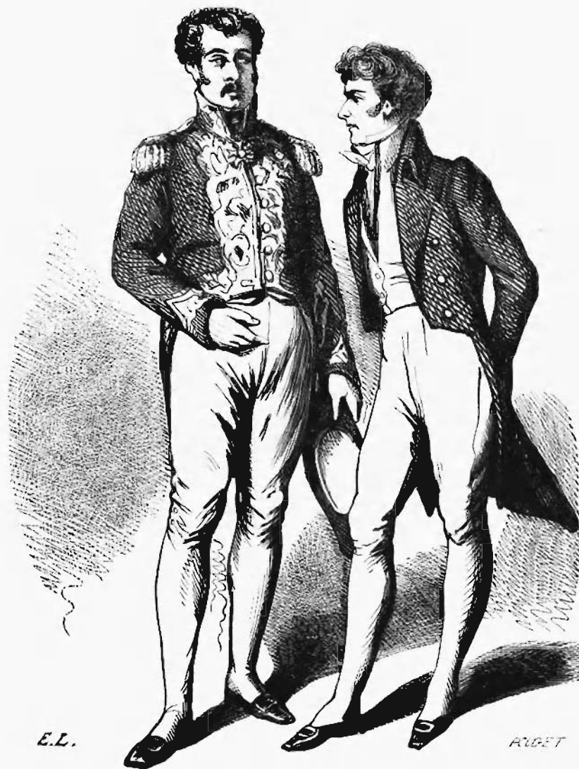
Le colonel sourit en regardant le maître des requêtes... — PAGE 55.

— Mon cher enfant, lui dit la vieille femme à l'oreille, songez désormais que nous savons aussi bien repousser les hommages des