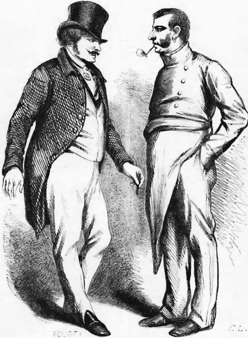
Mitouflet jeta successivement à sa pratique deux regards pleins d'une froide ironie.

— Drôle! s'écria Gaudissart, drôle! mais votre M. Vernier s'est donc moqué de moi?