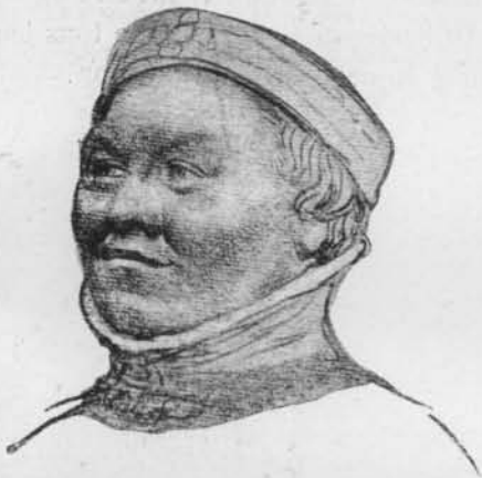
Fig. 6. — La même tête, mieux conservée, d'après le dessin de Holbein à Bâle.

semblance de cette tête est frappante avec celle du duc de Berry dans la statue agenouillée de Bourges (fig. 5), dont nous avons, outre l'original mutilé, un excellent dessin de Holbein (fig. 6) 2 , ainsi qu'avec le portrait du même personnage dans la première miniature des Heures de Chantilly (fig. 7) 3 .