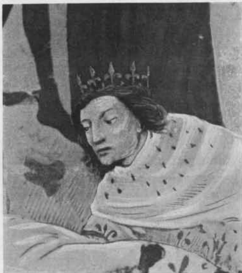
Fig. 10. — Saint Louis, d'après le manuscrit de Saint-Pétersbourg.

fondu saint Louis et Charles V, c'est qu'en vérité ils se ressemblaient 1 . On voudra bien comparer notre fig. 9 (où Charlemagne et saint Louis sont sur la gauche) avec la fig. 10, image agrandie de saint Louis soignant les malades dans le manuscrit des Grandes Chroniques de France à Saint-Pétersbourg 2 . Ce sont les mêmes traits, la même expression.