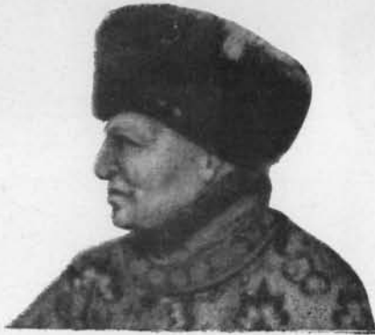
Fig. 7. — Tête du duc de Berry, d'après le frontispice des Très belles Heures de Chantilly (grandie).

je connaisse sur la physionomie de Henri V est un portrait de la National Portrait Gallery de Londres (n° 545), dont une photographie m'a été obligeamment fournie par M. Bell, du Musée Ashmoléen à Oxford (fig. 8); c'est une médiocre copie d'un original perdu, qui devait être excellent. Henri V mourut en 1422; son successeur Henri VI, alors âgé d'un an, fut proclamé en Angleterre et en France sous la régence de ses deux oncles, Gloucester et Bedford. Peut-être figurent-ils aussi sur le volet, car Hubert van Eyck, comme tous les Flamands d'alors, était attaché au parti dit bourguignon.