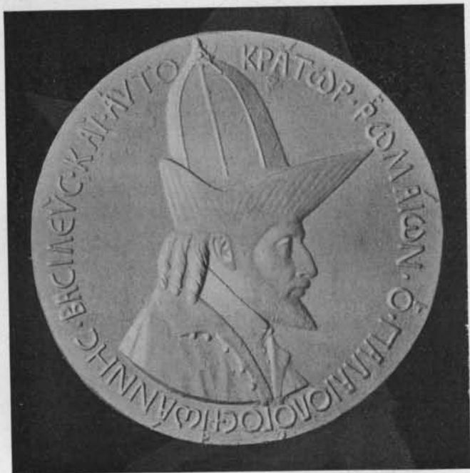
Fig. 3. — Médaille de Jean VI Paléologue, par Pisanello 3 .

Byzance, Jean VI Paléologue (1425-1448), dans le second cavalier au grand chapeau qui fait partie du cortège dit des juges intègres (fig. 2). Cette impression est devenue pour moi une certitude. C'est bien la même tête, avec coiffure, barbe et moustaches caractéristiques 1 , que sur la médaille de Pisanello 2 (fig. 3) et dans