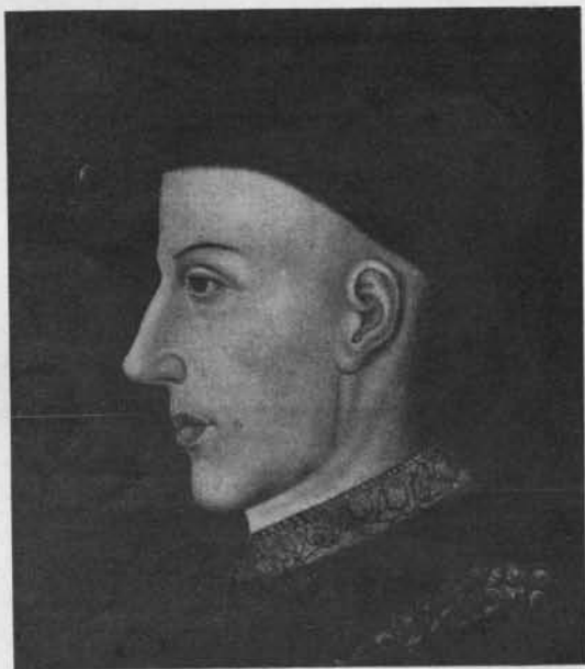
Fig. 8. — Tête du roi Henri V, d'après un tableau conservé à Londres.

nait récemment quelques raisons dignes d'examen 1 ; mais je ne puis admettre : 1° que le duc Jean de Berry, mort en 1416, figurât au milieu des preux de l' ancien temps; 2° qu'il figurât ailleurs qu'au premier ou au second rang; 3° qu'il fût représenté, vers 1420 comme un jeune homme, alors qu'il était né en 1340.