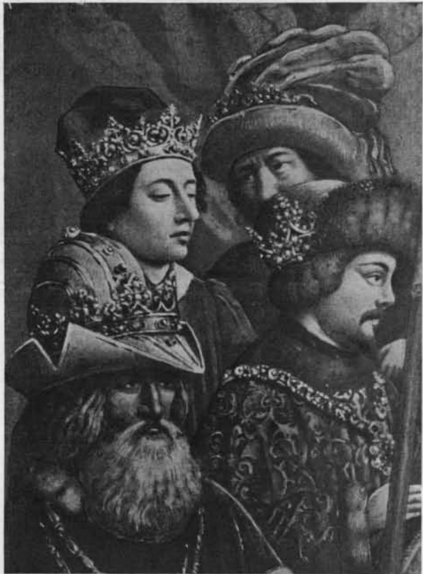
Fig. 9. — Personnages à gauche du volet B.

ancêtre commun des rois de France et des ducs de Bourgogne; Charlemagne et saint Louis (et non Charles VII) se font également pendant sur le grand tableau du Parlement de Paris, aujourd'hui au Louvre 1 . Il existait à cette époque une tradition