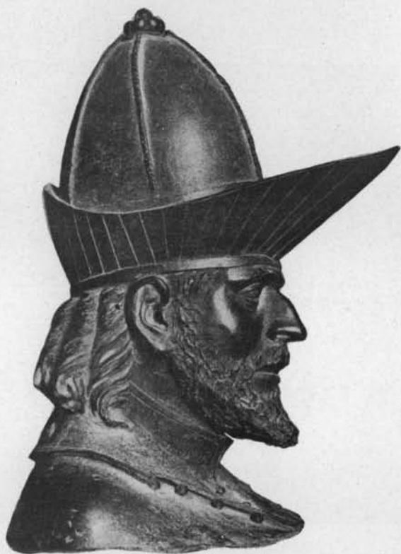
Fig. 4. — Buste de Jean VI Paléologue (Musée de la Propagande à Rome 2 ).

1424; c'est là qu'Hubert Van Eyck a dû le voir et qu'il a dû peindre ou dessiner son profil 1 . On sait que Vérone entretenait des relations suivies avec les princes de la maison de Bourgogne, auxquels