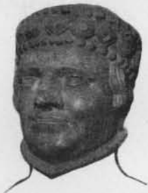
Fig. 5. — Tête du duc de Berry, d'après sa statue à Bourges.

Le premier cavalier du même cortège (fig. 2 à gauche) ne peut être Hubert van Eyck lui-même, comme le veut une tradition rejetée avec raison par M. Weale, mais que M. Durand-Gréville a encore reprise en 1910. C'est le duc de Berry, sans doute un des patrons d'Hubert, qui mourut en 1416. La res-