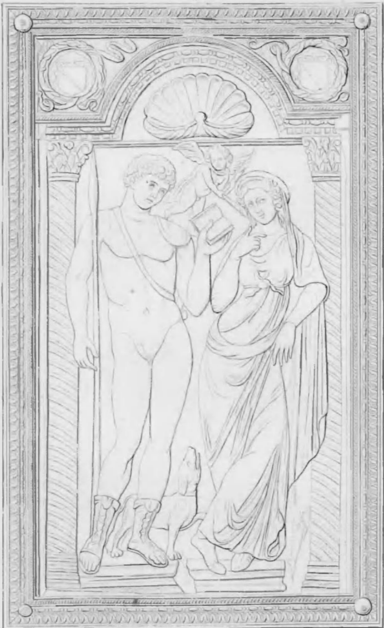
G.F. Neise del. et sculp. Göttingen 1866.