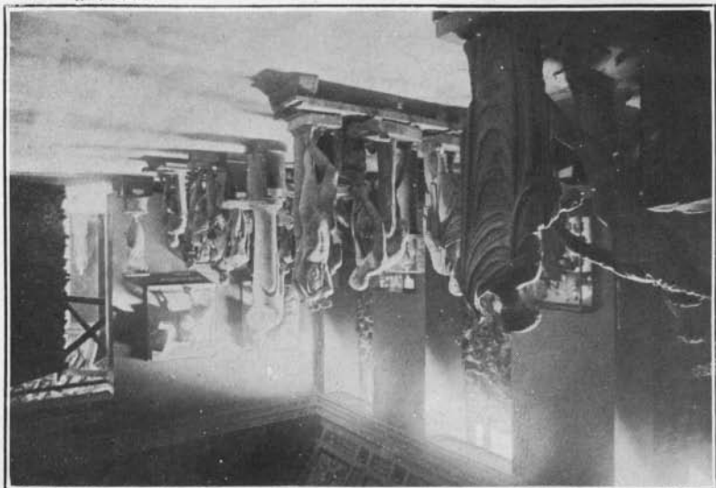
SOCIÉTÉ DES AMIS DU LOUVRE