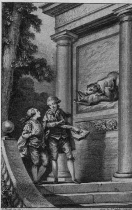
No. 20. — Boisard. Fables.

Cohen 74/75. Avec 1 portrait par Rigaud , gravé par Daullé , 5 fleurons sur les titres par Eisen , gravés par Boucher , 39 vignettes dessinées par Eisen , gravées par Aveline, de la Fosse ou non signées, 25 culs-de-lampe et 6 belles figures pour le Lutrin non signées, mais de Cochin .