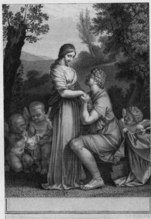
No. 6. — Bernard, P. J. Oeuvres.

Cohen suppl. 100. Très bel exemplaire orné d'un superbe frontispice par Caze , gravé par Le Bas , avec le portrait de Barre en médaillon, 1 portrait de Frédéric Auguste III, roi de Pologne, peint par de Sylvestre et gravé par Dauillé , 1 vignette non signée en tête de la