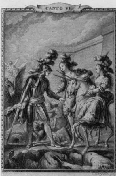
No. 3. — Arioste. Orlando furioso.