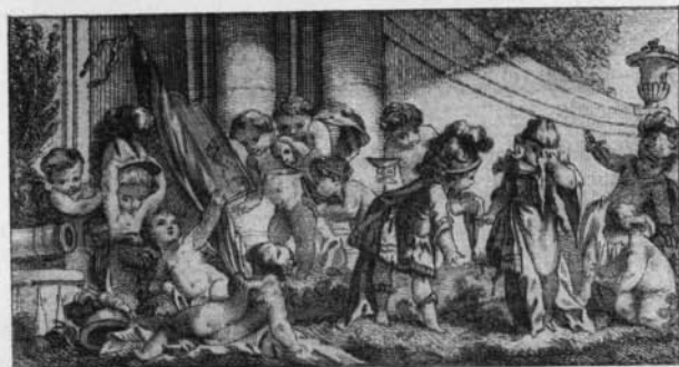
No. 19. — Boileau. Oeuvres.