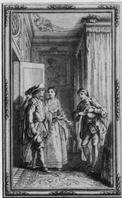
No 16—18. — Boccace Il decamerone.