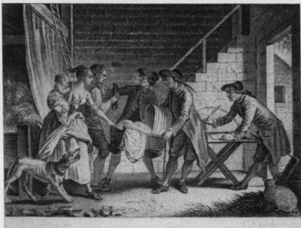
No. 10. — Berquin. Pygmalion .

7 BERNARD, P. J. Oeuvres. Ornées de 4 gravures d'après les desseins de Prud'hon: la dernière estampe gravée par lui-même. Paris, P. Didot l'aîné, 1797, gr. in-4, demi-rel. de l'époque. 60—