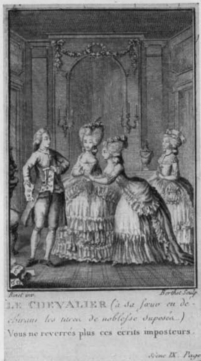
No. 14. — Billardon. Les Après-Soupers.

Cohen 58. Exemplaire en grand papier de Hollande, avec 1 frontispice, 6 charmantes figures par Marillier , gravées par De-launay jeune et Ponce avant les numéros et 6 feuillets de musique gravée.