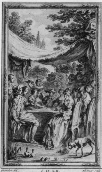
No. 16—18. — Boccace. Il decamerone.

Recueil de poésies de Piron, Piis, Chaulieu, Voltaire et autres auteurs.