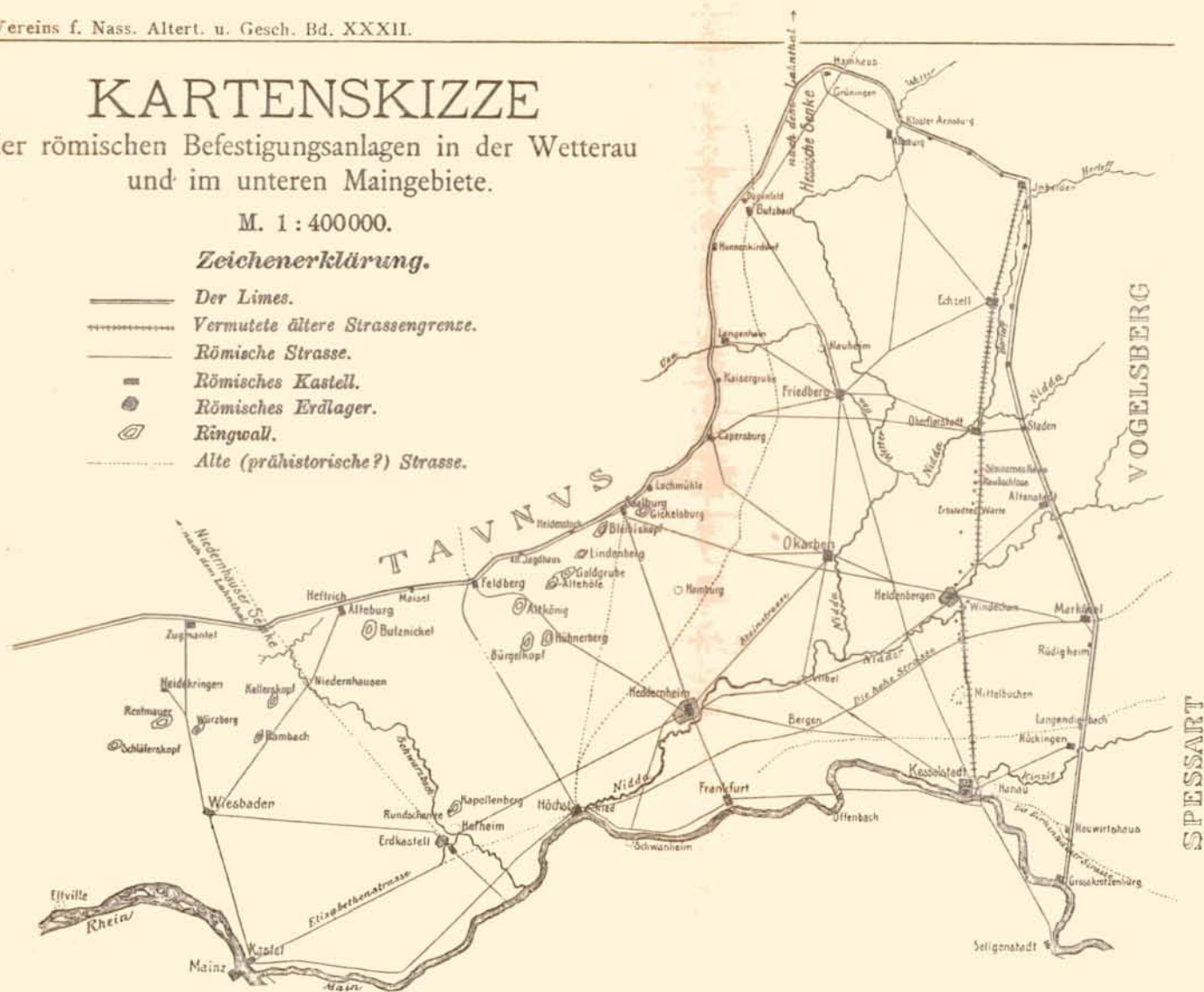
LES ENVIRONS DE FRANCFURT