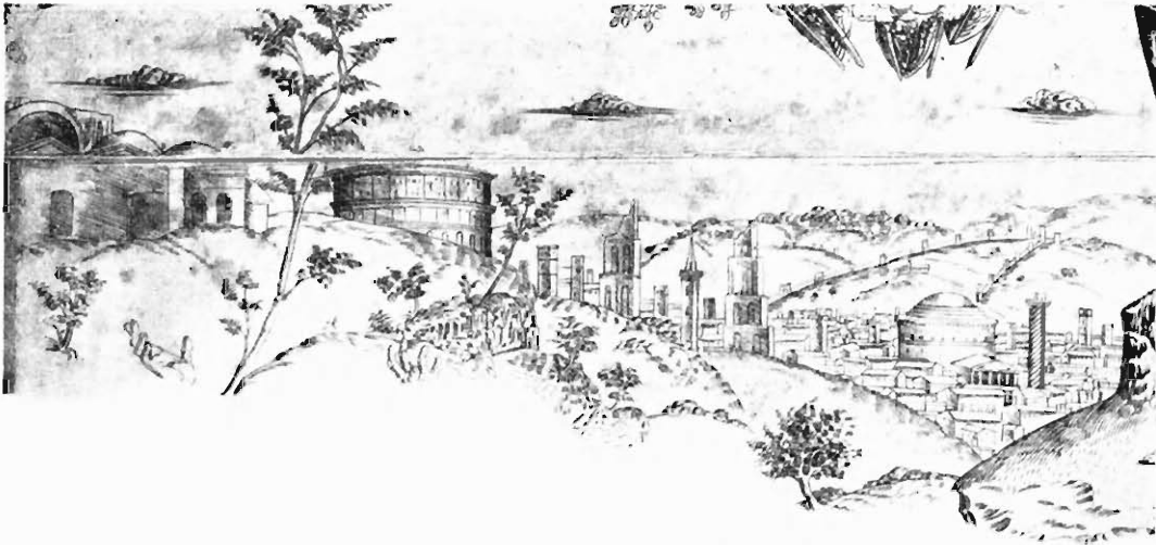
Abb. 1. Ansicht von Rom im Hintergrund des Botticelli zugeschriebenen Kupferstiches der Himmelfahrt Mariä (Abbildung im Gegensinne).