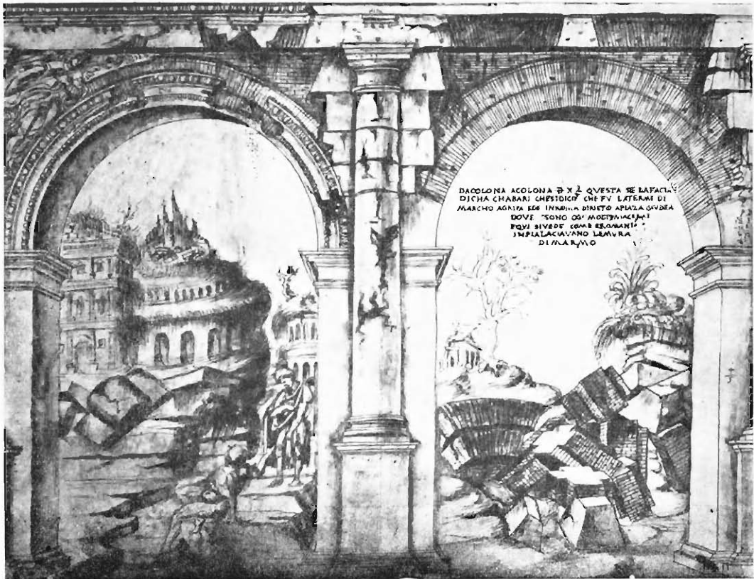
Abb. 2. Porticus Minucia in Rom mit Durchblick auf Septizonium und Ruinen des Palazzo Maggiore, Zeichnung Giulianos da Sangallo im Barberinisch-Vatikanischen Skizzenbuch.

2. Der Holzschnitt in Hartmann Schedels Weltchronik (Nürnberg 1493). Reproduziert bei De Rossi: „Pianta Iconografiche e prospettiche“ (Roma 1879) tav. V.