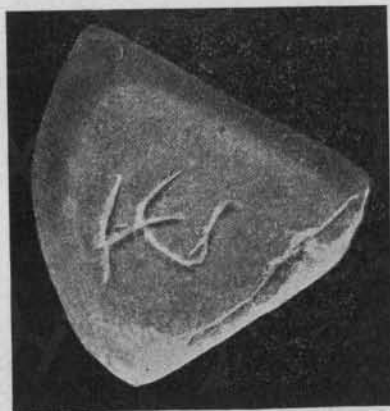
FIG. 1. — GALET MAGIQUE.

magiques à voyelles comme il en pullule dans les formules de sorcellerie (Preisendanz, Papyri graecae magicae , p. 86). — Le galet est authentique.