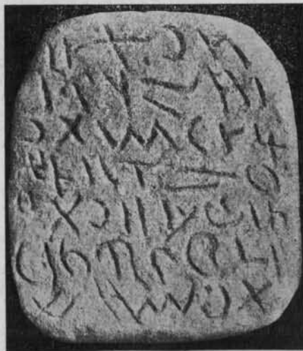
FIG. 5. — INSCRIPTION DE Sextilius .