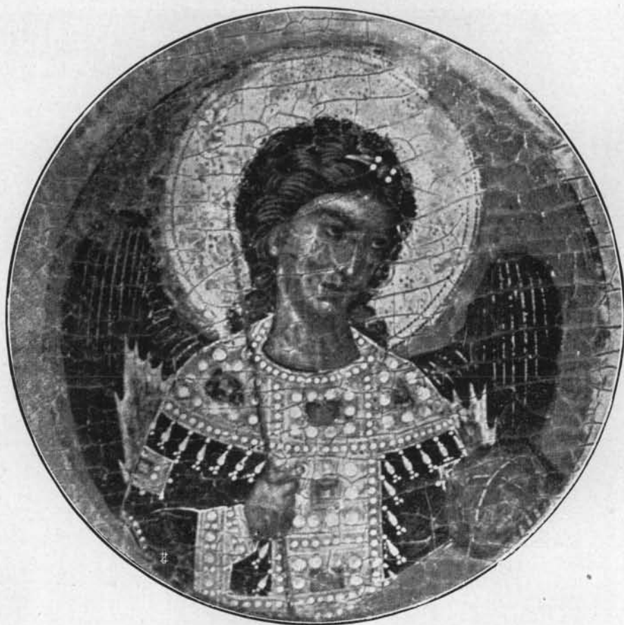
UN ANGELO DELLA MADONNA KOHN.

soie, de samis, de robes vaires et grises, et hermines et de tous les fiers avoirs qui onques furent en terre trovés... Puis que li mondes fu estorés n'ot en une cité tant de gaaigné „ (7). Un contemporaneo aggiunge: “ Ils coururent sus à Sainte Yglise premièrement et brisièrent les abéies et les robèrent „. Non si fa menzione, è vero, di dipinti in queste parole; ma ecco che dice Paulin Paris di quel saccheggio: “ Un nombre infini d'objets précieux, tels que reliques, peintures, sculptures, pierres-gravées, livres et bas reliefs, fut alors transporté de Constantinople dans les Églises de France et d'Italie „. Possiamo dunque essere certi che