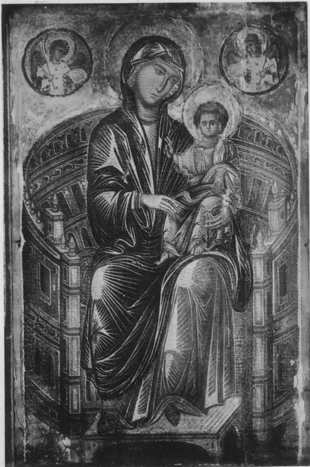
MADONNA IN TRONO, D'UN PITTORE COSTANTINOPOLITANO DEL SEC. XII RACCOLTA CARL HAMILTON, NUOVA YORK