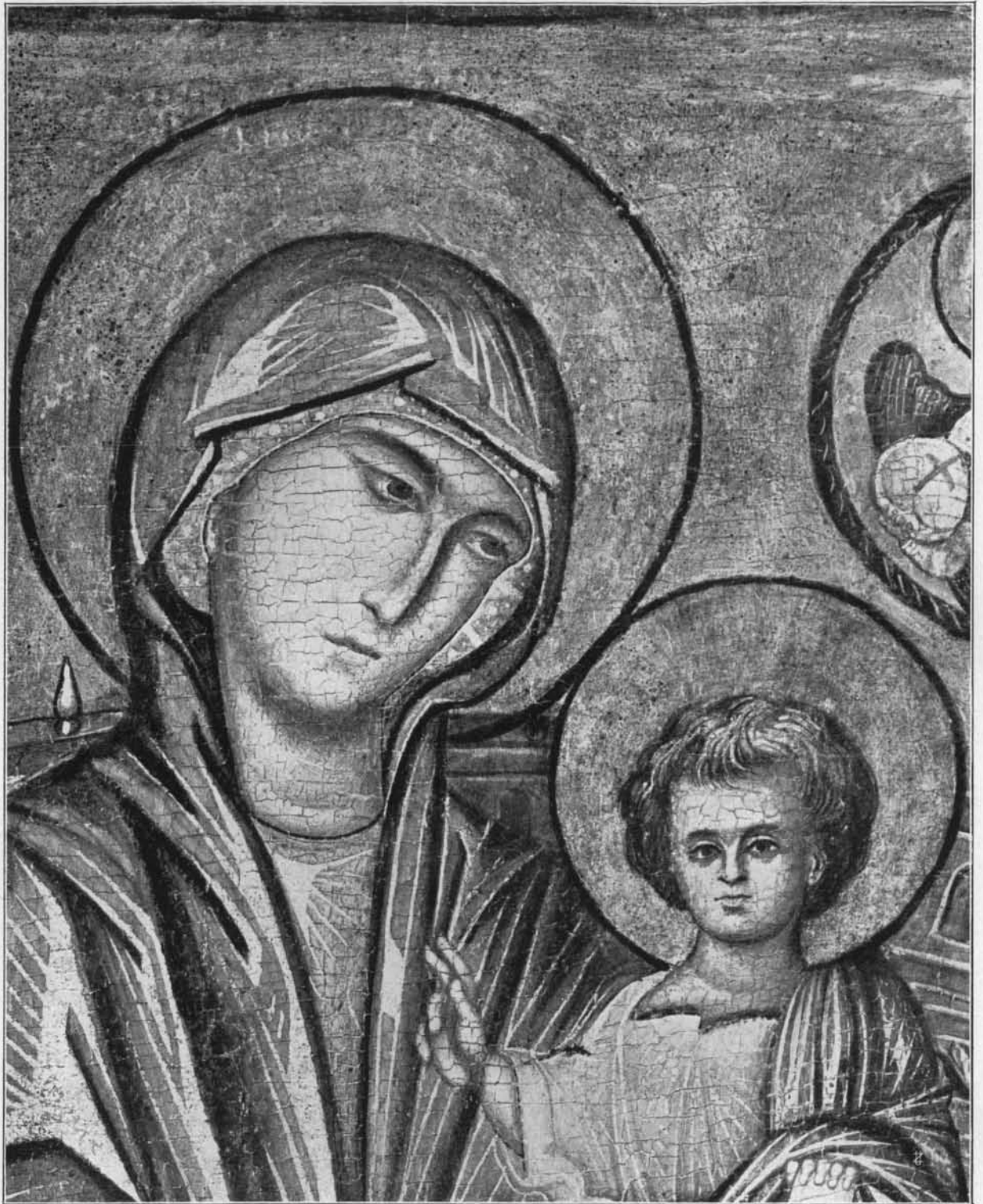
UN PARTICOLARE DELLA MADONNA HAMILTON - NUOVA YORK.