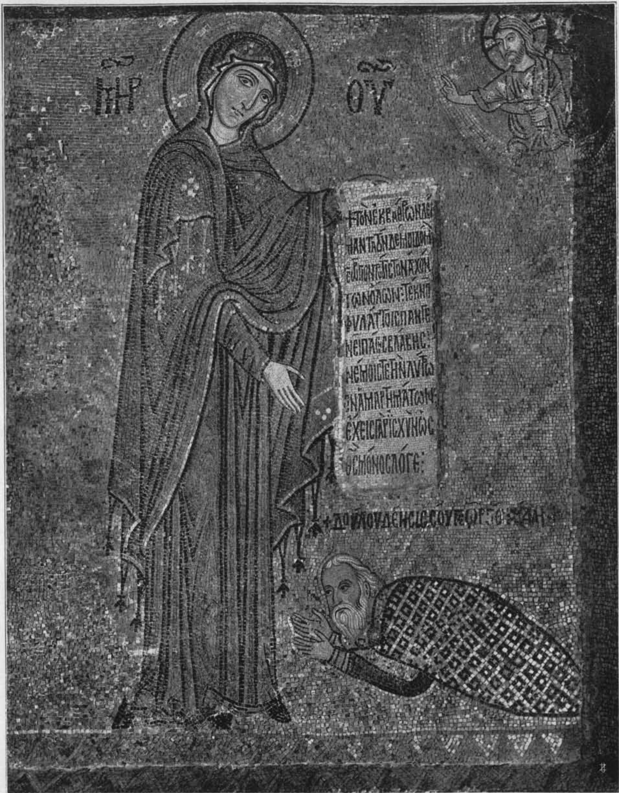
GIORGIO ANTIOCHENO AI PIEDI DELLA VERGINE - MOSAICO GRECO NELLA CHIESA DELLA MARTORANA, A PALERMO - METÀ DEL SECOLO XII.