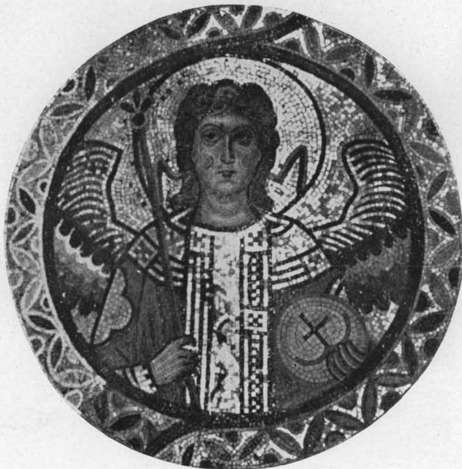
UN ARCANGELO, NELLA CAPPELLA PALATINA DI PALERMO - METÀ DEL SECOLO XII.

tori che vedono lineare e preciso contro i pittori che vedono fuso e sfumato, dei pittori che vedono oscuro contro i pittori che vedono chiaro: essendo questi in perpetuo gli estremi tra i quali oscilla la storia della pittura di figura, anzi di tutta la pittura.