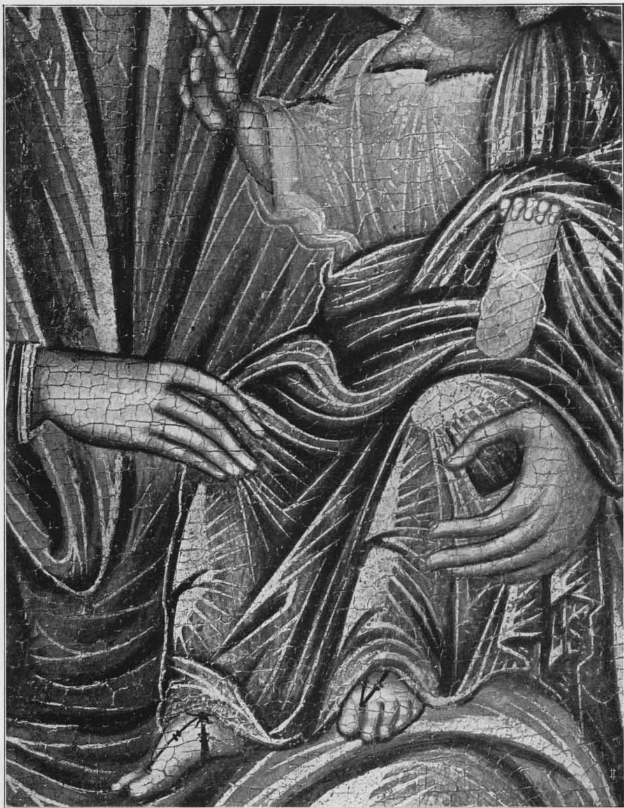
UN PARTICOLARE DELLA MADONNA HAMILTON - NUOVA YORK.