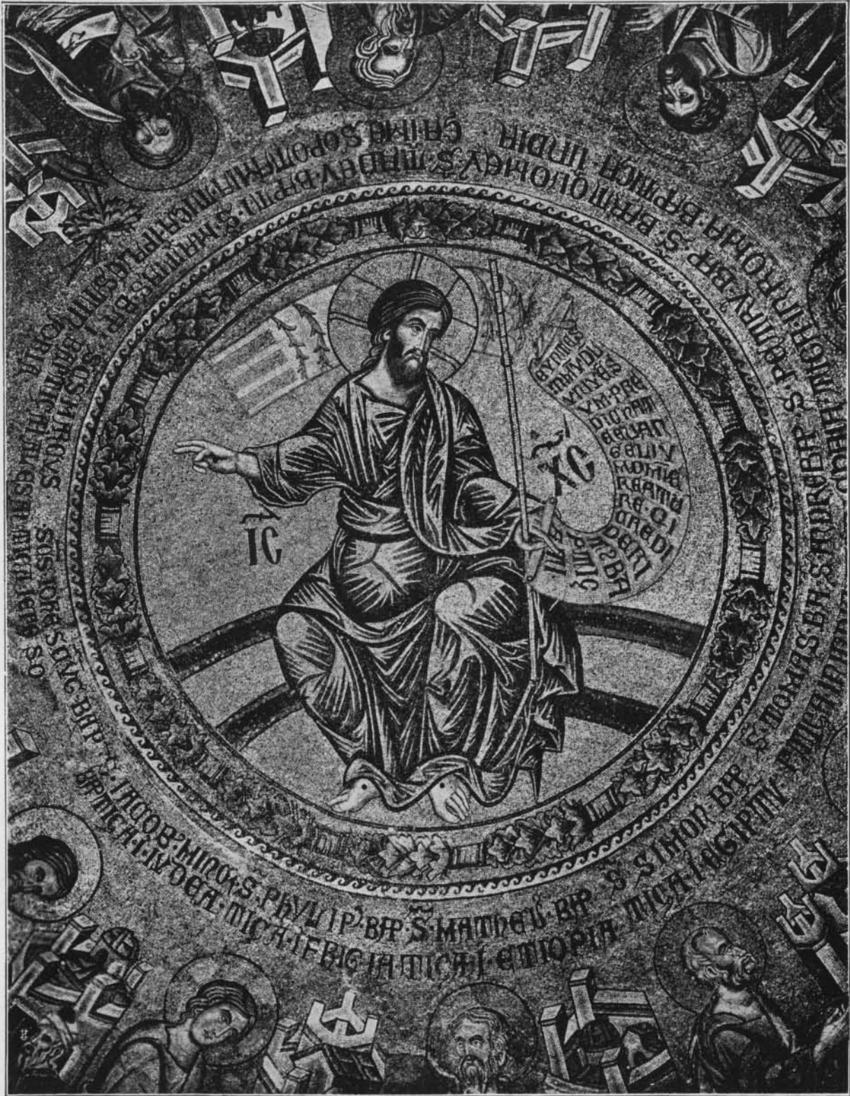
IL SALVATORE: MOSAICO TRECENTESCO IN SAN MARCO DI VENEZIA.