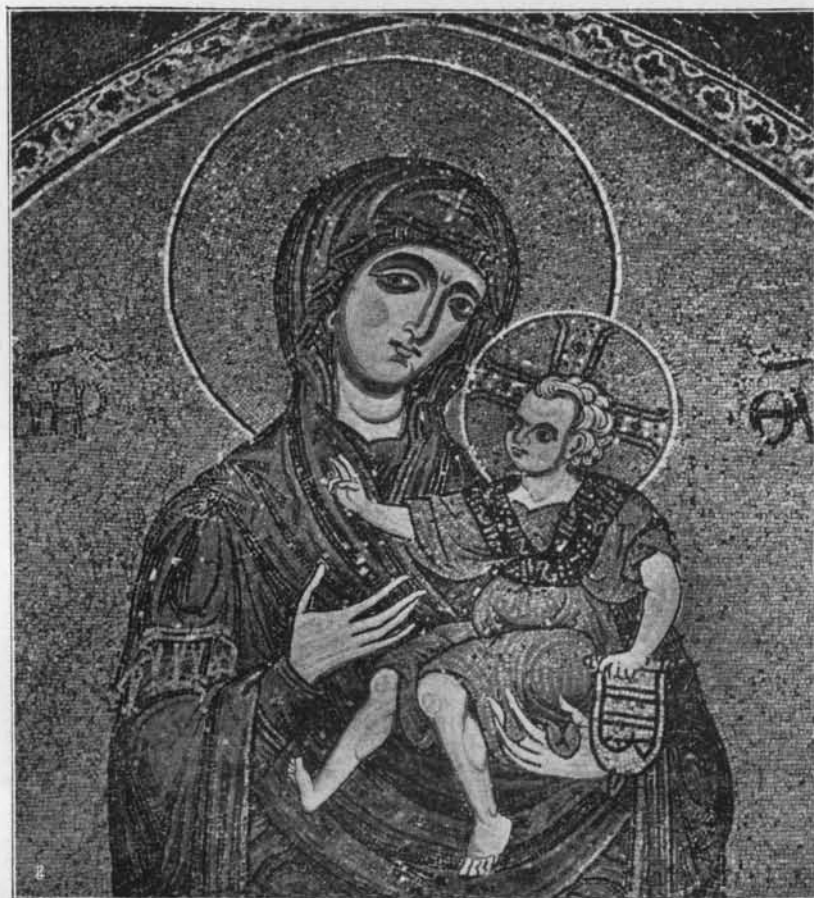
NELLA CATTEDRA- LE DI MONREALE. 1715-1200.

scettri, stole e globi, ritrovano i loro perfetti compagni nell'Arcangelo Raffaele della Cappella Palatina di Palermo, (pag. 302) in un medaglione con la testa di Sant'Andronico a Dafni, e in vari medaglioni con angeli e teste di santi a Santa Sofia di Kiev: tutte opere anch'esse di mano greca.