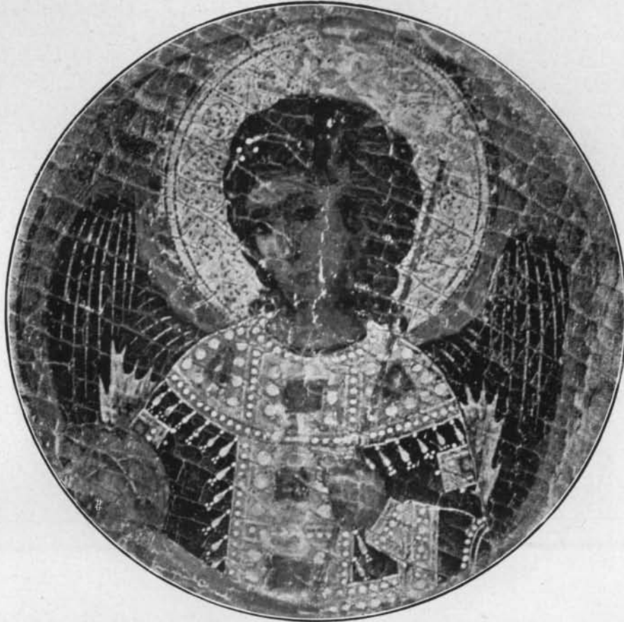
UN ANGELO DELLA MADONNA KAHN.

petenti finiranno per accettarla, noi avremo conquistato un punto di partenza per lo studio della pittura bizantina prima della fine della sua epoca più gloriosa; un punto di partenza che finora è mancato, o almeno è rimasto ignoto a noi occidentali. Solo allora saremo in grado di tracciare qualche idea sullo stato della pittura a Costantinopoli; di separarla dai prodotti delle provincie e delle regioni dominate dalle sue tradizioni; di giudicare, infine, dei suoi imitatori, altrove, più capaci, per via di confronto, l'energia creativa fino a Pietro Cavallini, a Cimabue, a Duccio.