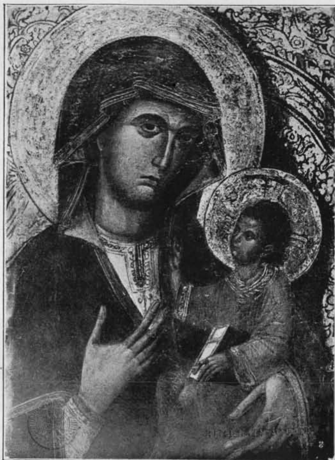
MADONNA COL BAMBINO: