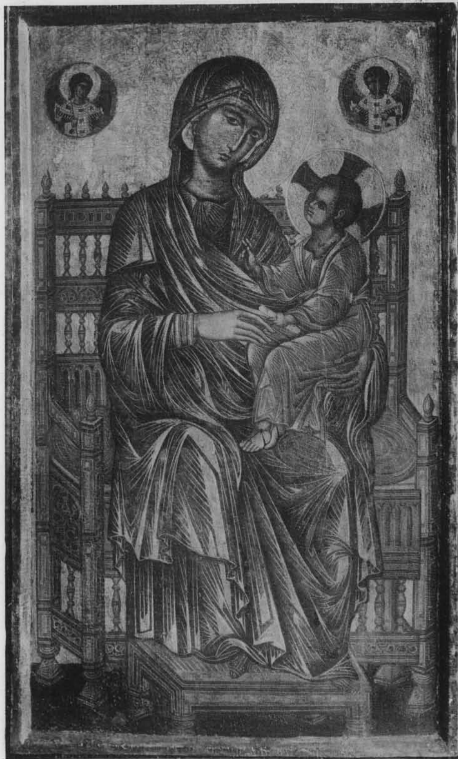
MADONNA IN TRONO, D'UN PITTORE COSTANTINOPOLITANO DEL SEC. XII RACCOLTA OTTO KAHN, NUOVA YORK