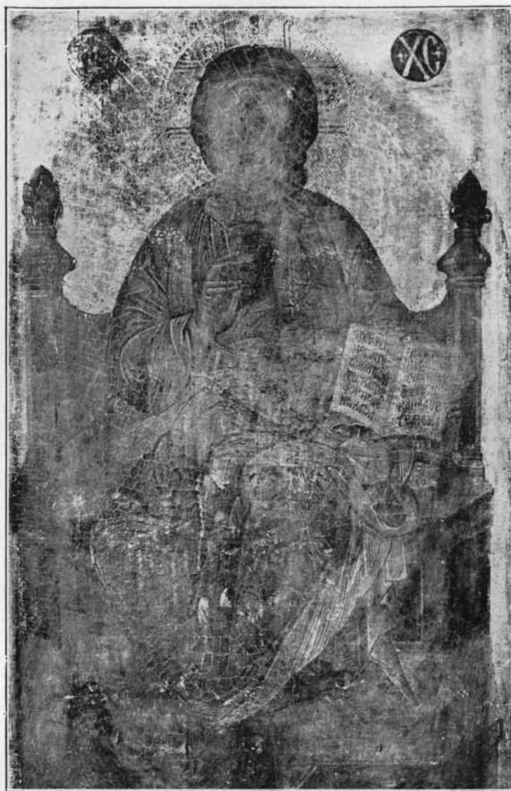
IN SANTA FRANCE- SCA ROMANA.

l'eleganza, la soavità e insieme la limpi- dezza e il fasto del colore. In questa scuola