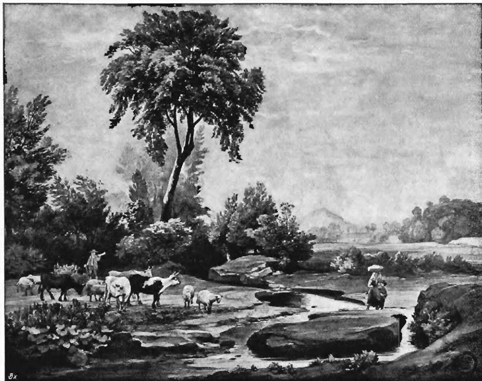
Johann Wilhelm Schirmer: An der Trante. (Original im Besitz der Königl. Hochschule für bildende Künste in Berlin.)

Burg an der Wupper), W. von Beckerath's (Mula des Gymnasiums zu Erfurt), Klein-Chevaliers Mathausaal zu Erfurt), Ludwig Kellers (Mula des Gymnasiums zu Duisburg) gedacht.