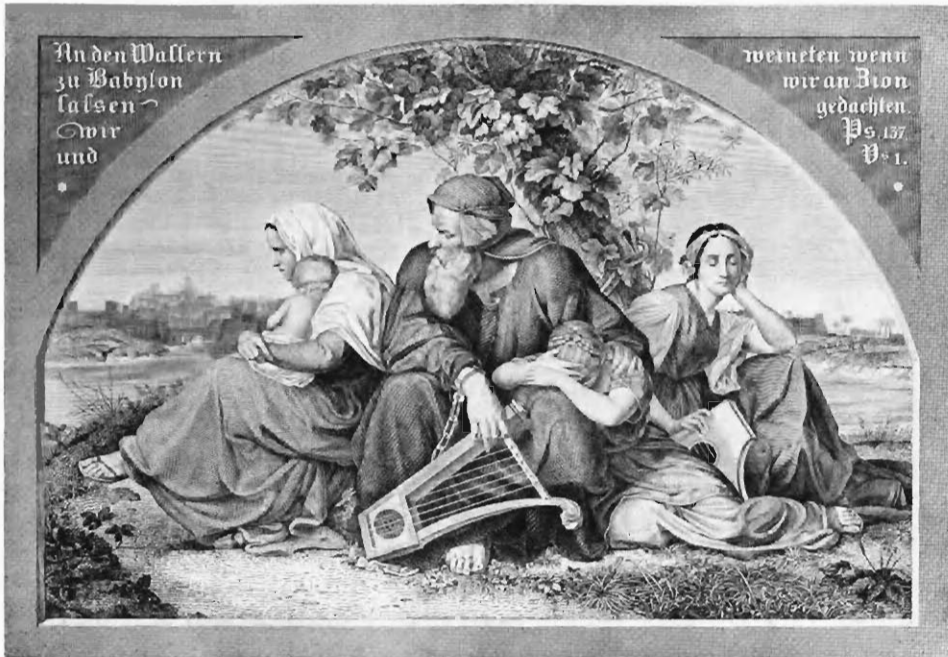
Eduard Bendemann: An den Wassern von Babylon.

nen: „Der Pinsel ist der Verderb unserer Kunst.“ Ludwig I. von Bayern meinte einmal kauslich zu der Kunst seines Akzdemiedirektors — bereits nach neun Jahren siedelte er in dieser Stellung von Düsseldorf nach der Kfarstadt über —: „Er kann nichts malen!“