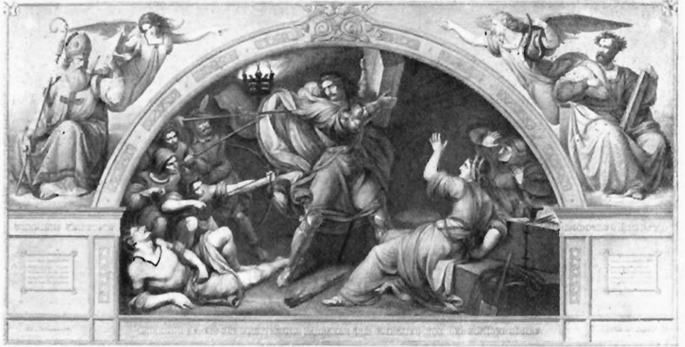
Rudolf Julius Benno Hübnert: Roland befreit die Prinzessin Isabella von Galizien aus der Räuberhöhle. (Nach einem Stich von Joh. Keller.)

Carstens, der kein Modell und keine Naturstudie anerkannte, in gewissem Sinne als einen „Dichter der Linie“ bezeichnen kann.