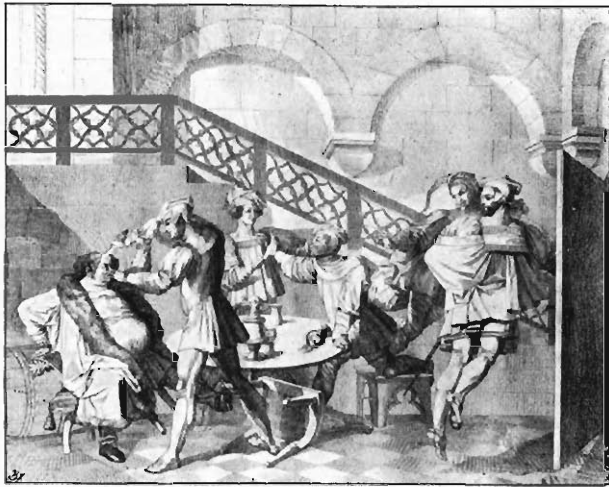
Peter Cornelius: Auerbachs Keller. (Aus den Janus-Zeichnungen.) (Nach einer Vorlage aus dem Besitz der Königl. Hochschule f. bild. Künste in Berlin.)

nicht mehr da. Die Herstellung jener großgeplanten Sammlung von Gipsabgüssen gab schon gleich der Nachfolger Johann Wilhelms, sein Bruder Karl Philipp, der Düsseldorf und die Kunst gleich wenig liebte, sofort auf, ja er ließ sogar das bereits vorhandene völlig zerstören. Und die berühmte, herrliche Gemäldegalerie wurde bekanntlich in der Napoleonischen Zeit nach München geschickt, wo sie denn auch geblieben ist trotz aller Reklamationen, die erst auf Wunsch Kaiser Wilhelms I. nach dem deutsch-französischen Krieg eingestellt wurden, in Anerkennung der großen Verdienste der Bayern während dieses Krieges. Nur ein ganz kleiner Teil blieb Düsseldorf erhalten, darunter die große Rubens'sche „Himmelfahrt Mariä“, die mit einigen guten Werken italienischer Künstler in der heutigen