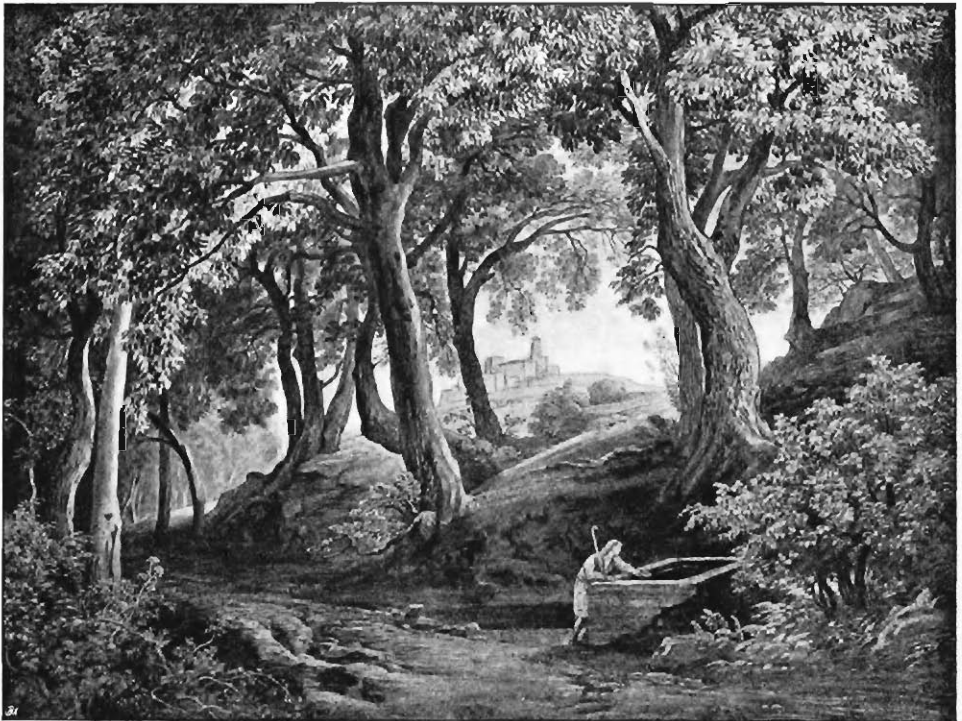
Johann Wilhelm Schirmer: Waldbrunnen.