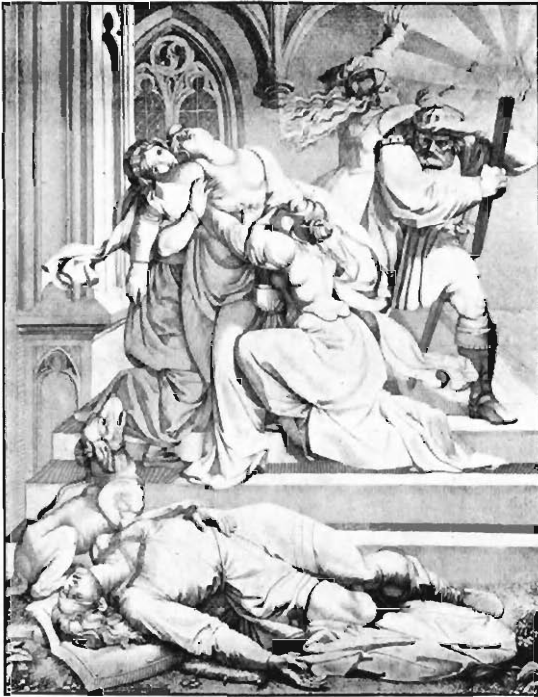
Peter Cornelius: Kriemhild an der Leiche Siegfrieds. (Aus den Zeichnungen zu den „Nibelungen“.) (Nach einer Vorlage aus dem Besitz der Königl. Hochschule für bildende Künste in Berlin.)