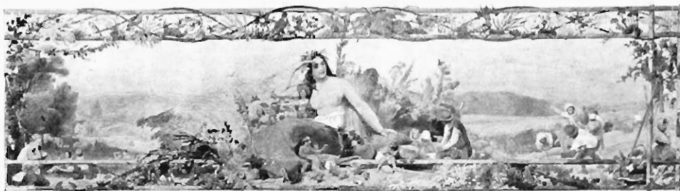
Adolf Schroedter: Entwurf zu einem Wandfries. (Nach einer Vorlage aus dem Besitz der Erben des Künstlers.)

Reaktionsnotwendigkeit und weil sie auf heimischem Boden kein Verständnis und keine Unterstützung gefunden hatten oder zu finden fürchteten, hatten sich in Rom einige deutsche Künstler zusammengetan. Rom war noch, wie in den Jugendtagen Goethes, der Mittelpunkt deutschen Kunstlebens, wie Paris, Brüssel, Antwerpen Etappen auf dem Wege dorthin.