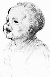
Endwig Knaus: Kinderköpchen. (Nach der Original-Zeichnung aus dem Besitz der Königl. Akademie der Künste in Berlin.)