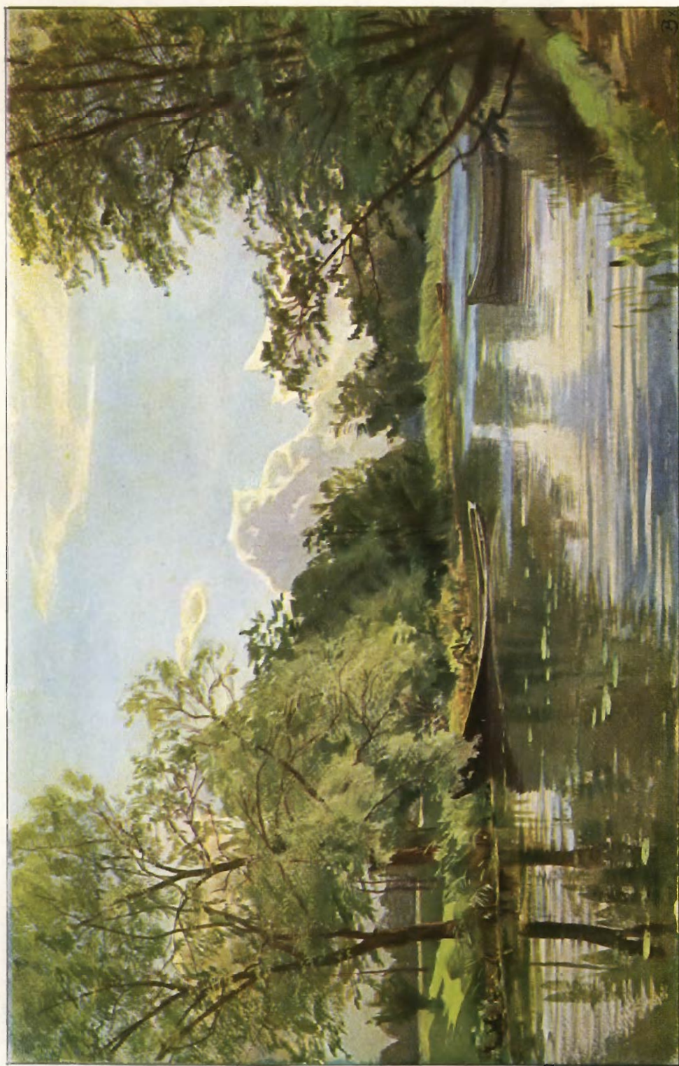
Eugen Dürker: Sommerabend. Studie.