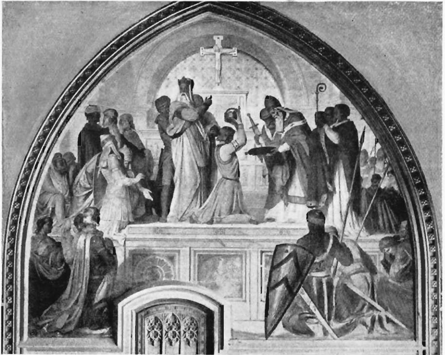
Alfred Rethel: König Ludwig des Frommen. (Ausgeführt von Josef Kehren.) Freskogemälde im Kaiserpal zu Aachen.

eine ganz lichte Färbung, feierliche Stillierung der Figuren und der Komposition nach den Vorbildern der alten Italiener; hier ein Schwelgen in dunkeln rotbraunen und braungelben Tönen mit hier und da nur lebhafteren Farbenakzenten, eine starke Bewegung von meist theatralischem Aufbau und Ausdruck, keine „göttliche Nacktheit“ oder antike Gewandung, sondern realistische Trachten, mittelalterliches Rüstzeug, flatternde