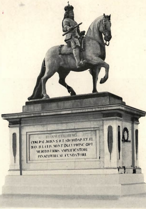
Gabriel von Grupello: Reiterstandbild des Kurfürsten Johann Wilhelm in Düsseldorf.

Schon sehr bald nach seinem Regierungsantritt faßte er den Plan, eine große Bildergalerie anzulegen. Ein niederländischer Künstler von Ruf, Johann Franz Douven, den er bei seinem Regierungsantritt schon vorgefunden, war ihm bei der Ausführung, bei dem Ankauf von Gemälden in Deutschland und in den Niederlanden behilflich; die