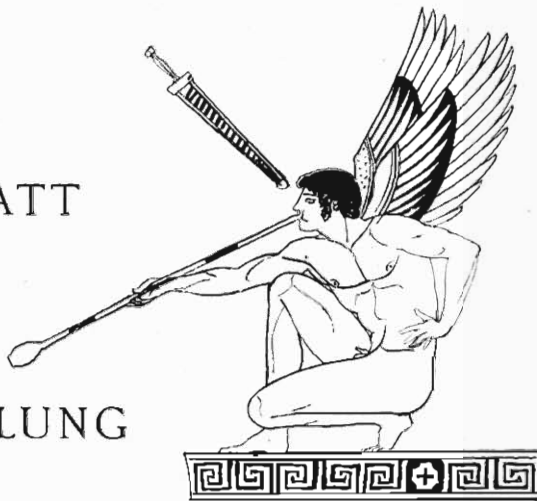
Eros, rothfigurige Lekythos aus Gela