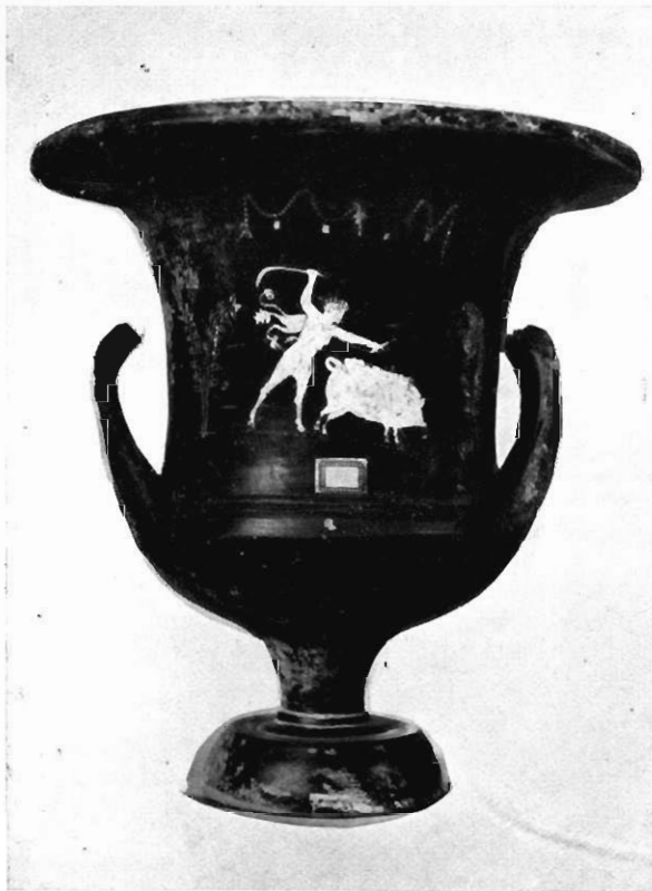
Tav. II - Crateri del Museo di Bari e del Museo di Lecce.