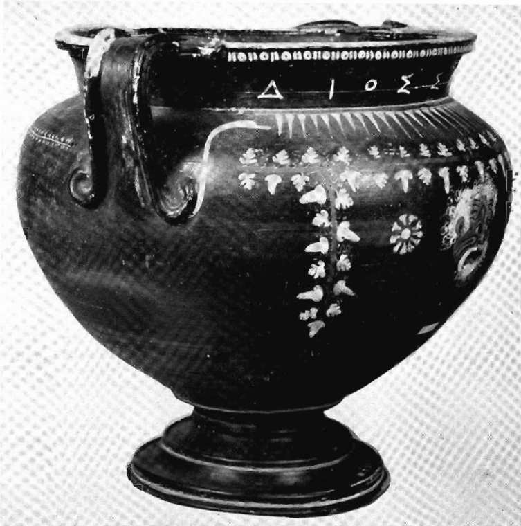
TAV. III - Cratere del British Museum.