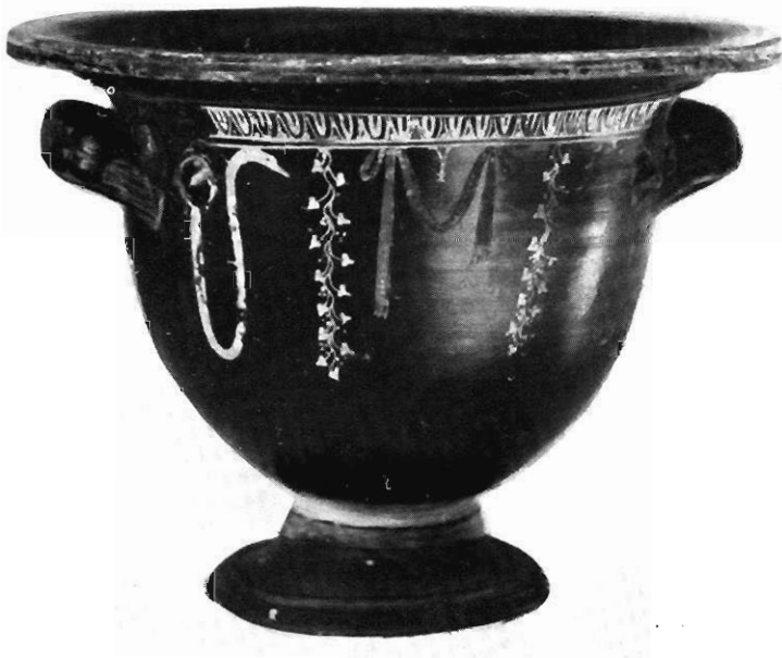
Тав. IV - Crateri del Museo di Matera.