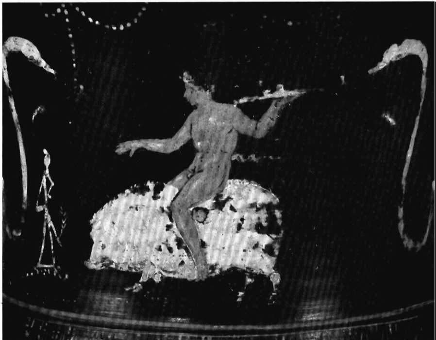
Tav. I - Cratere B 676 del Museo dell'Ermitage.