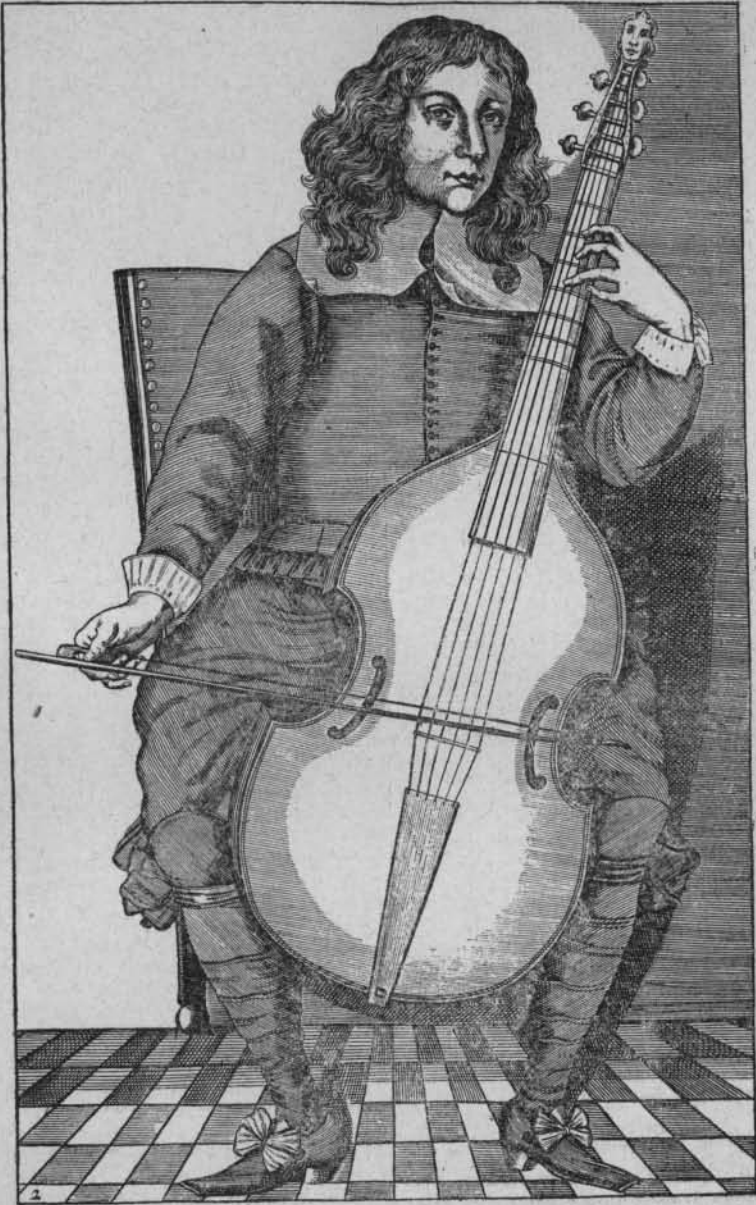
Joueur de viole de gambe (XVII e siècle).