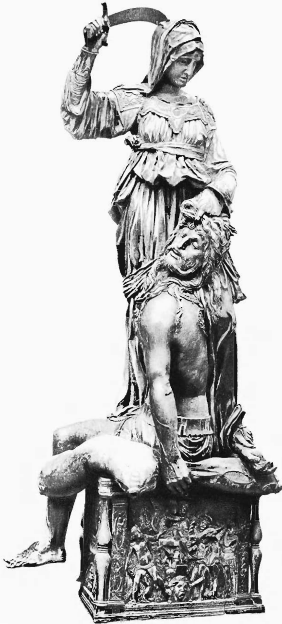
JUDITH DE DONATELLO