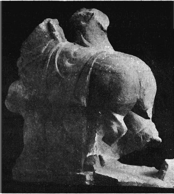
Fig. 2. — Groupe de Nérís.

passé : c'est alors une sorte de transfusion. Quoi qu'il en soit, le « passage par une ouverture » est un rite superstitieux, dont les modalités peuvent varier à l'infini, et qui, relégué aujourd'hui dans les bas-fonds de la médecine populaire, a dû constituer autrefois une des ressources favorites de la médecine