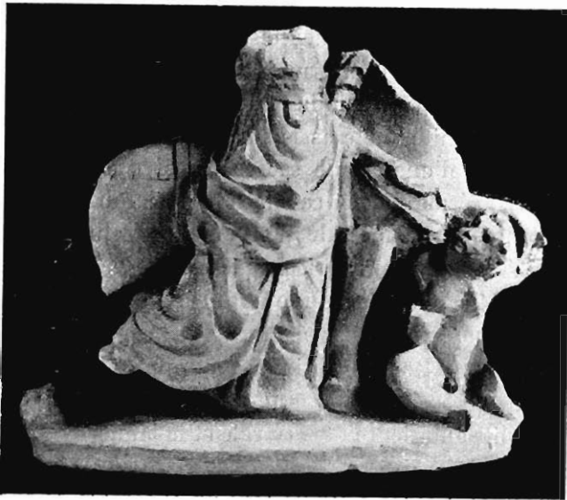
Fig. 1. — Groupe de Néris.

d'une telle réputation, que non seulement il servait à tous les enfants de la localité, mais que les enfants de Draguignan et même de Cannes faisaient plus de 60 kilomètres pour bénéficier du traitement. M. Gaidoz écrivait encore (p. 80) : « Si l'enfant ou le malade doit être nu, ce n'est pas [comme on l'a pensé] une réminiscence de la naissance : c'est parce que la nudité est de nécessité dans un grand nombre de rites; c'est aussi pour que