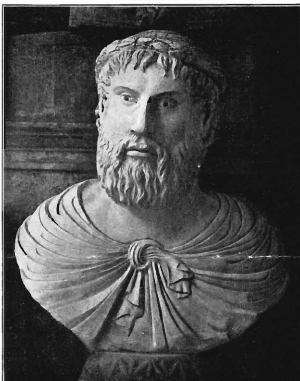
Abb. 4. Büste des Petrus de Vinea (?) im Museo Campano zu Capua. Nach Gips

1) Vergleiche den Aufsatz von Winkelmann in den Mitteilungen des Institutes für österreichische Geschichtsforschung XV. S. 401 f, mit Münztafel.