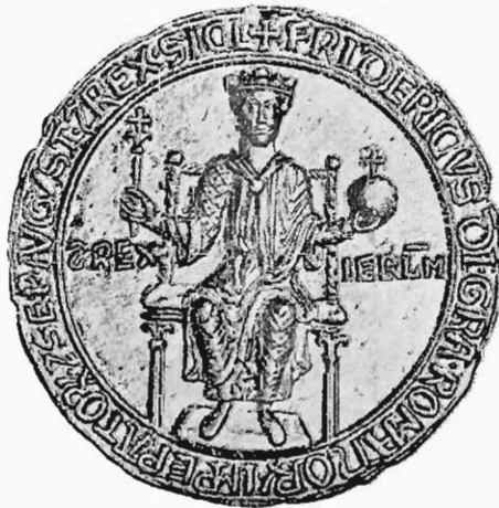
Abb. 7. Siegel Friedrich's II. Nach Mitt. d. Inst. f. ost. Geschichtsforschung XV.