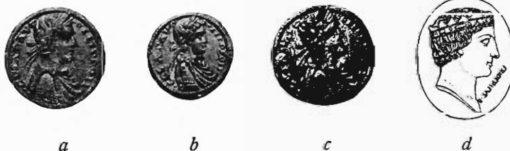
Abb. 6. a-c Augustalen Friedrich's II. - d sogenannte Raumer'sche Gemme. Nach Mitt. d. Inst. f. österr. Geschichtsforschung XV.