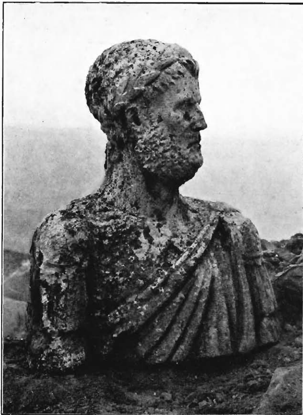
Abb. 2 und 3. Büste Friedrich's II. von Hohenstaufen (?) in Acerenza

die Nase scharf und schmal mit knappen Flügeln, der Mund klein und einfach geformt, mit dünnen Lippen; die Mundwinkel sind herabgezogen. Das untere Ohrläppchen ist angewachsen, die Muschel breit und eckig, die Öffnung gross und lang. Das Kopfhaar ist kurz geschnitten, von Natur etwas gelockt und fällt in kleinen Wischen rings in die Stirn, in der Mitte in ein paar längeren Ringeln. Der kurze Vollbart lockt sich stärker als das Kopfhaar, der Schnurrbart ist sehr knapp geschnitten.