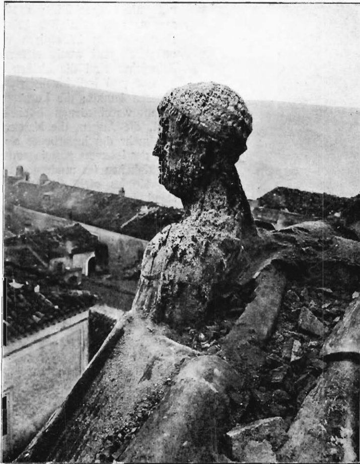
Abb. 1. Büste Friedrich's II. von Hohenstaufen (?) in Acerenza