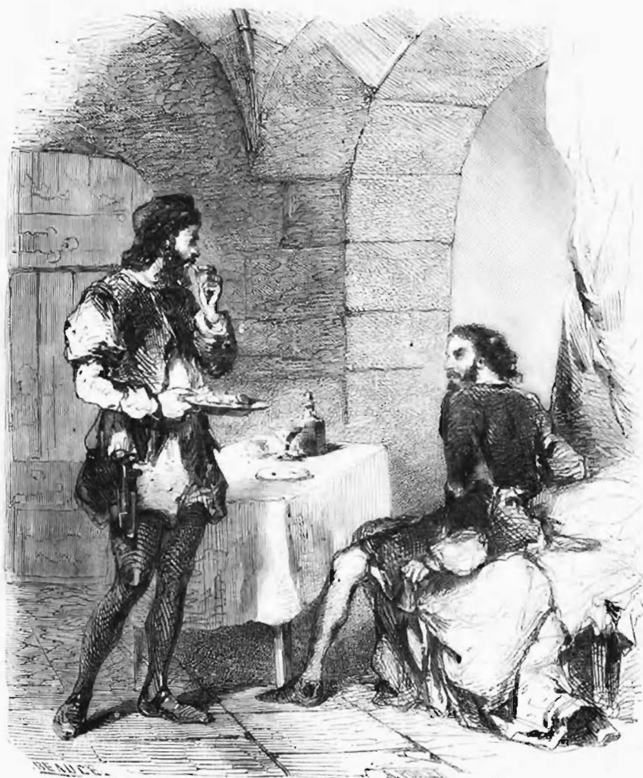
Son géôlier le rassura en goûtant le premier des mets qu'il venait de lui servir. — Page 6

mille écus qu'il devait le reconquête de son royaume.