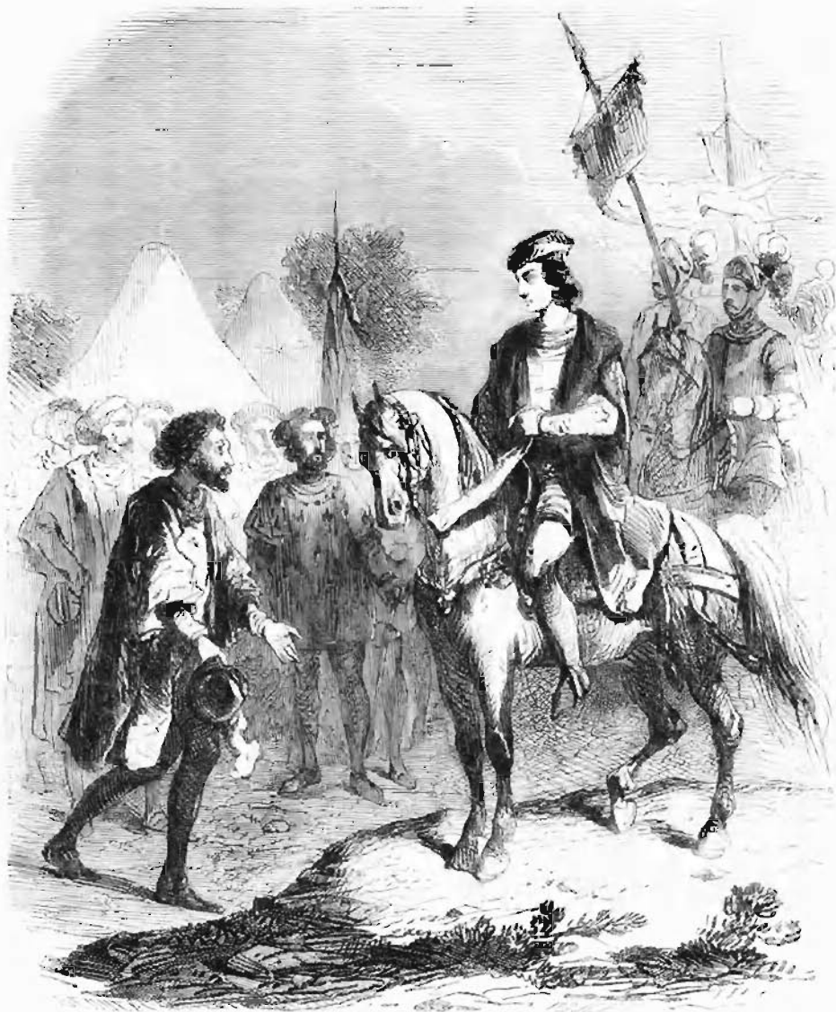
Charles VIII le reçut à cheval. — Page 18

A chaque exaltation nouvelle la coutume était alors que tous les États chrétiens envoyassent à Rome une ambassade solennelle pour renouveler individuellement leur serment d'obéissance au saint-père. Chaque ville nomma donc ses ambassadeurs, et Florence fit choix, pour la représenter, de Pierre des Médicis et de Gentile, évêque d'Arezzo.