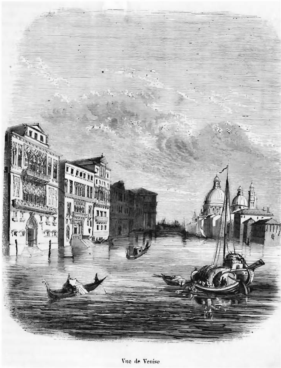
Vue de Venise