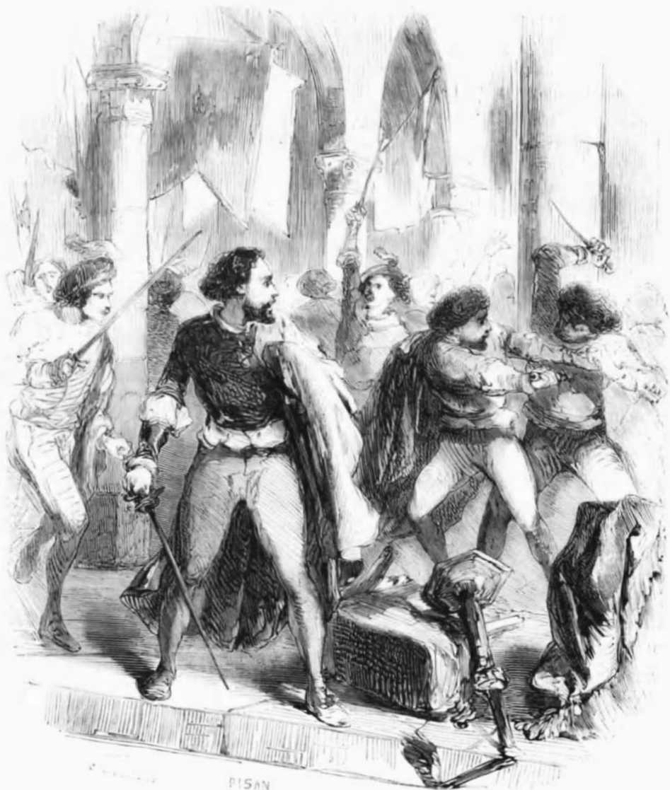
Il se mit en défense, en appelant à son aide ses deux écuyers. — Page 15.

gouvernement vénitien, et reparurent à Florence pour monter sur un même échafaud. Chaque jour de nouvelles sentences d'exil allaient frapper les citoyens dans leur famille; et les sentences étaient plus ou moins sévères, selon que la fortune ou la position de ceux qu'elles frappaient en pouvaient faire pour Côme des ennemis plus ou moins dangereux. Enfin les proscriptions furent si nombreuses, qu'un des plus grands partisans de Côme crut devoir aller lui dire qu'il finirait par dépeupler la ville: Côme leva la tête d'un calcul de change qu'il faisait,