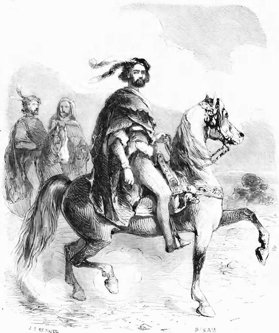
Laurent de Médicis.

patricienne, vit la branche aînée des Médicis réduite à trois bâtards : Jules, qui était déjà cardinal, et Hippolyte et Alexandre, qui étaient encore enfants, le premier n'ayant que huit ans et le second neuf.