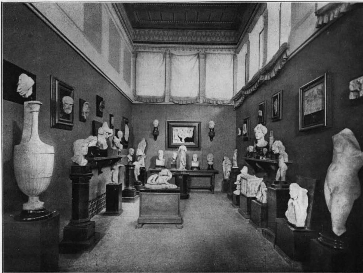
MUSEO BARRACCO - INTERNO DELLA SECONDA SALA.

l'oggetto, e così, per dirla ancora una volta con Goethe, egli amava l'oggetto non per sè, ma per l'erudizione e la cultura che se ne poteva trarre.