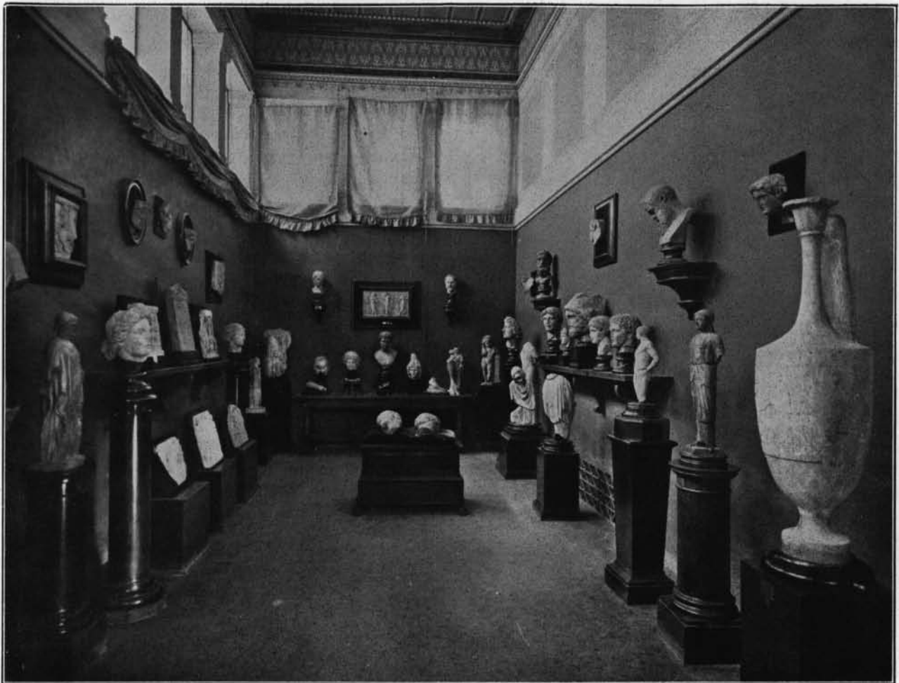
MUSEO BARRACCO - INTERNO DELLA SECONDA SALA.

che può considerarsi come data in dono; le altre raccolte furono vendute o andarono disperse.