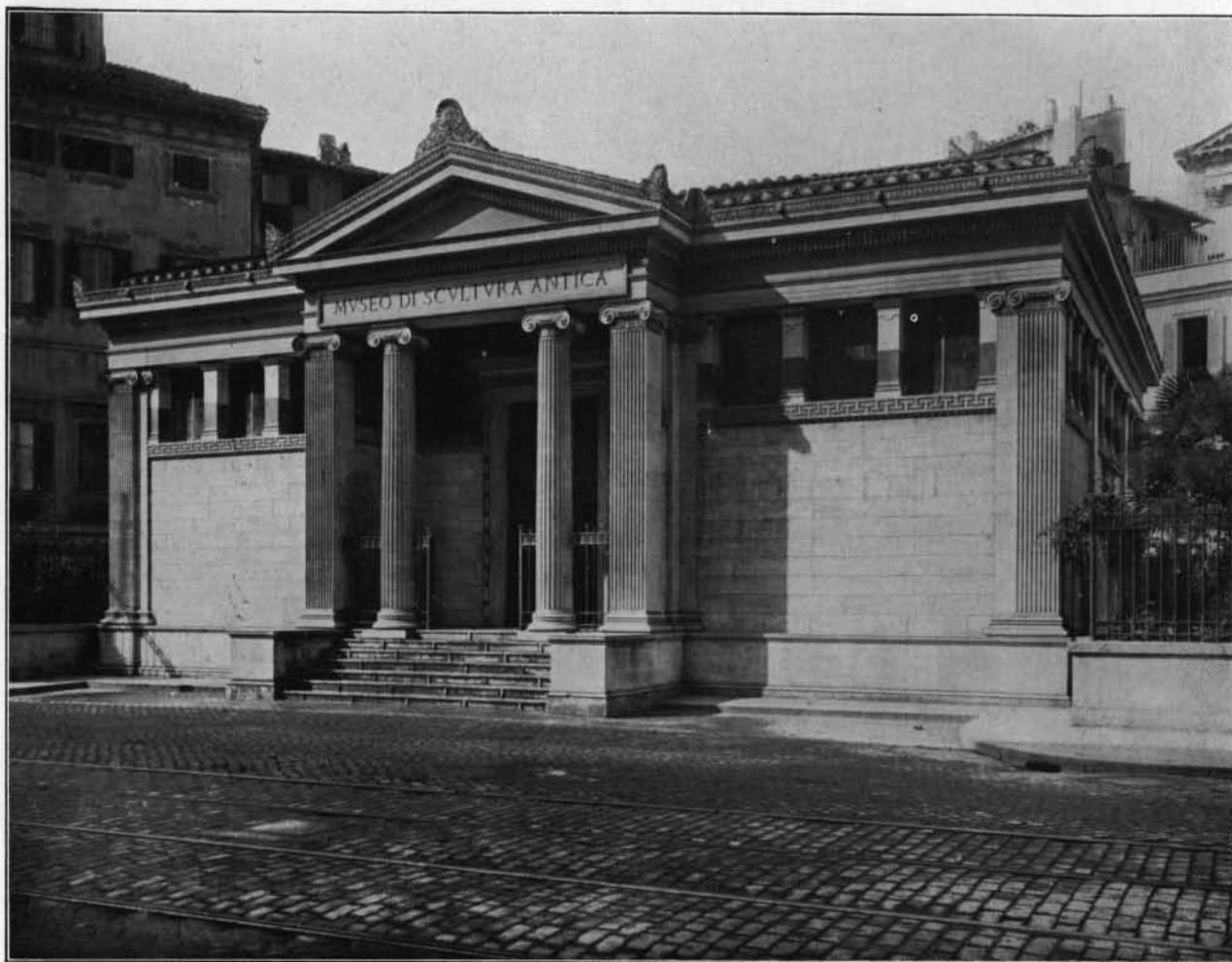
INGRESSO AL MUSEO BARRACCO AL CORSO VITTORIO EMANUELE.