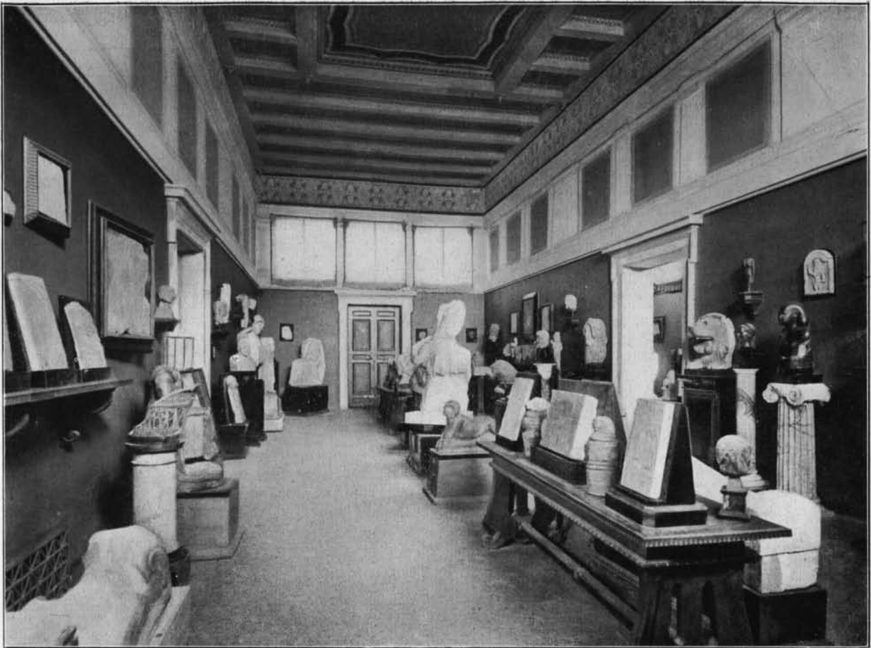
MUSEO BARRACCO - INTERNO DELLA PRIMA SALA.