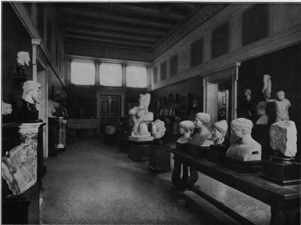
MUSEO BARRACCO - INTERNO DELLA PRIMA SALA.

chi, un ex-domenicano secolarizzato, reduce da Pietroburgo, dov'era stato ad insegnare nella Corte Imperiale. Il Colecchi, un Kantiano convinto, dava la più grande importanza al concetto del dovere ed in questo senso educò i suoi allievi. Le idee del filosofo abruzzese divennero e rimasero per il Barracco pratica di vita. Un altro suo maestro fu Bertrando Spaventa.