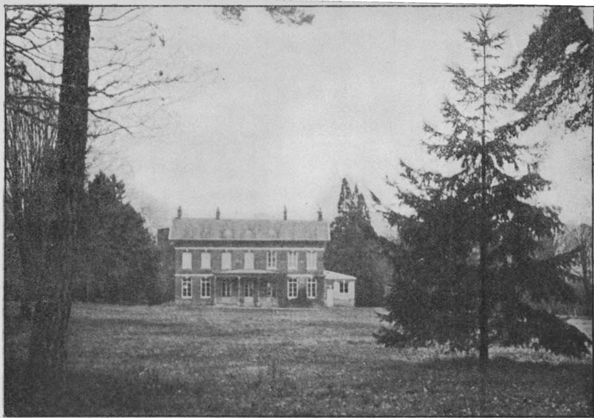
Séjour à la campagne d'Ymare. — Vue générale de l'établissement et des pelouses.