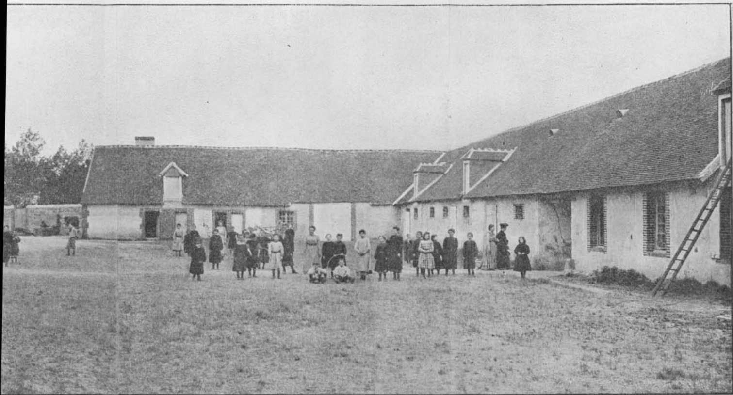
des Bezards. — Ferme de la Poste. — Vue générale.