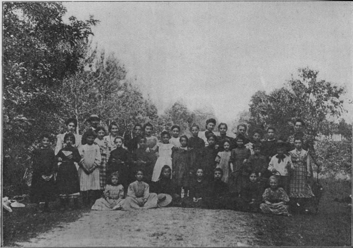
Promenade en forêt. — Environs des Bezards.