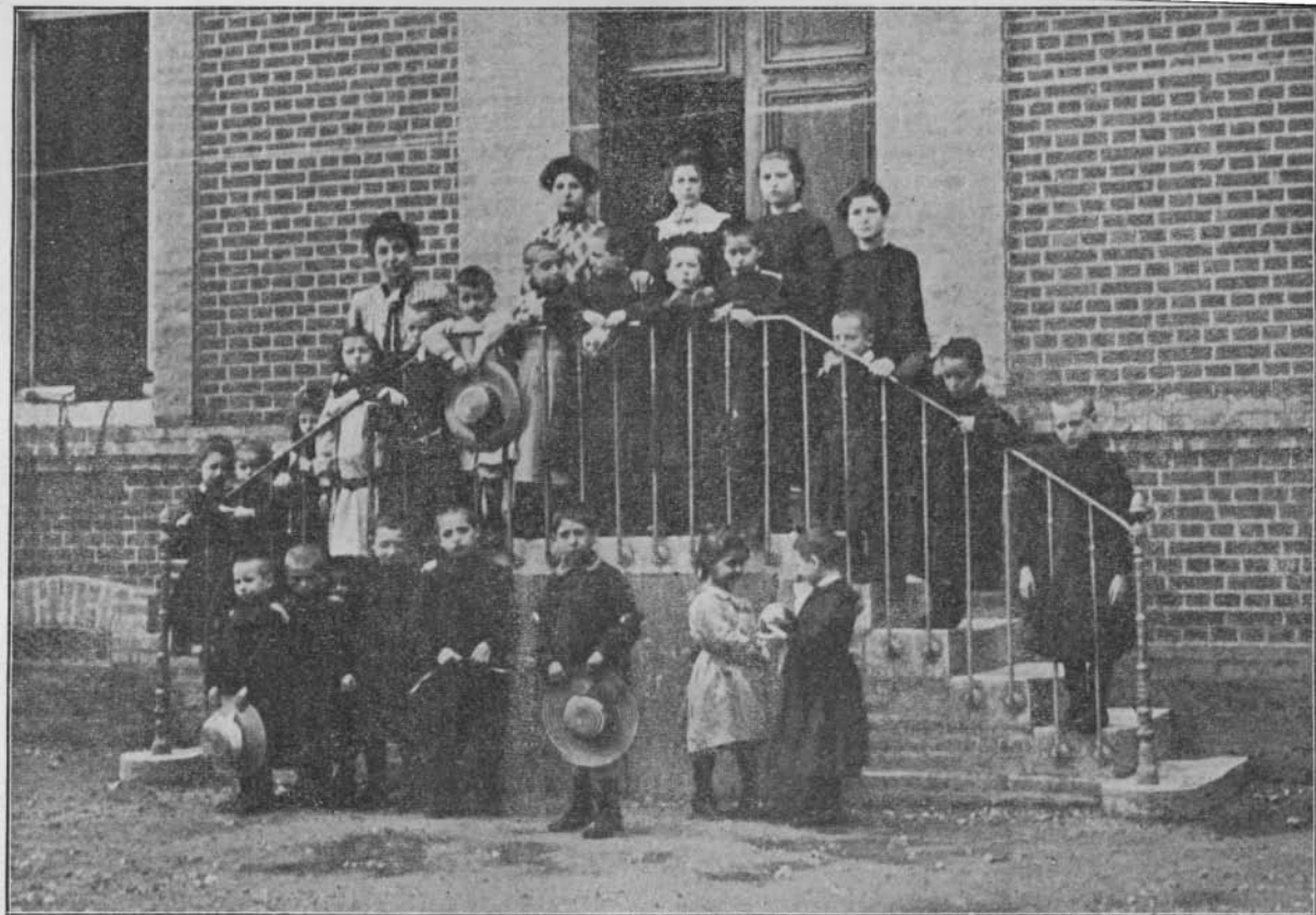
Œuvre des Séjours à la campagne. — Une série enfantine.