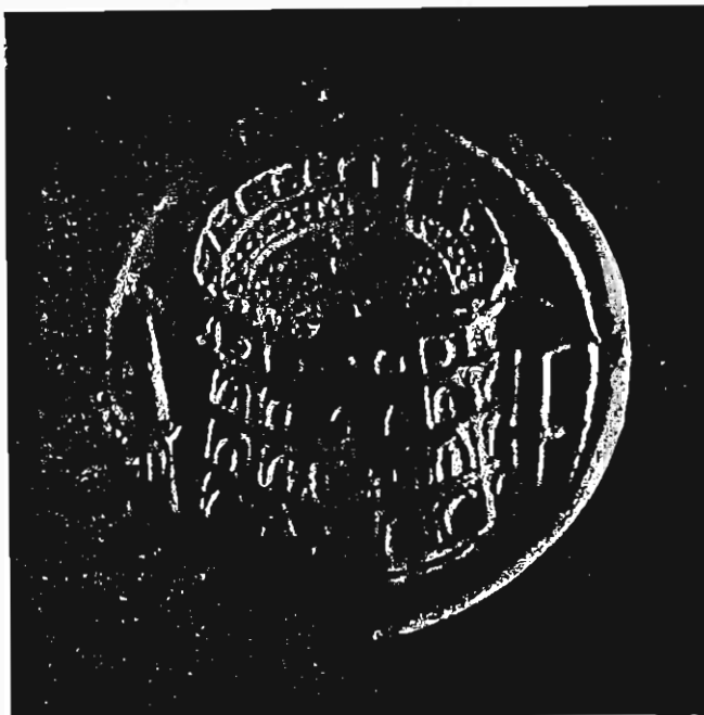
Figura 2. a (3).

Non so se possa chiamarsi del pari una libertà l'aver rappresentato il quarto ordine