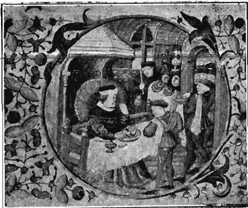
MINIATURE D'ENCADREMENT D'UNE PAGE DE CALENDRIER EN TÊTE D'UN LIVRE D'HEURES FRANÇAIS DU XV e SIÈCLE (Bylands Library, Manchester.)

Il existe, semble-t-il, une quarantaine de miniatures du xv e siècle représentant des vues partielles de Paris. On ne peut dire, cependant, que ces miniatures soient toutes connues; plusieurs ont été seulement signalées et décrites sommairement. MM. Vuaffart et Deville en préparaient un recueil au moment où la guerre arrêta leur travail; mais les photographies qu'ils avaient recueillies à cet effet sont encore aux mains de M. Vuaffart.