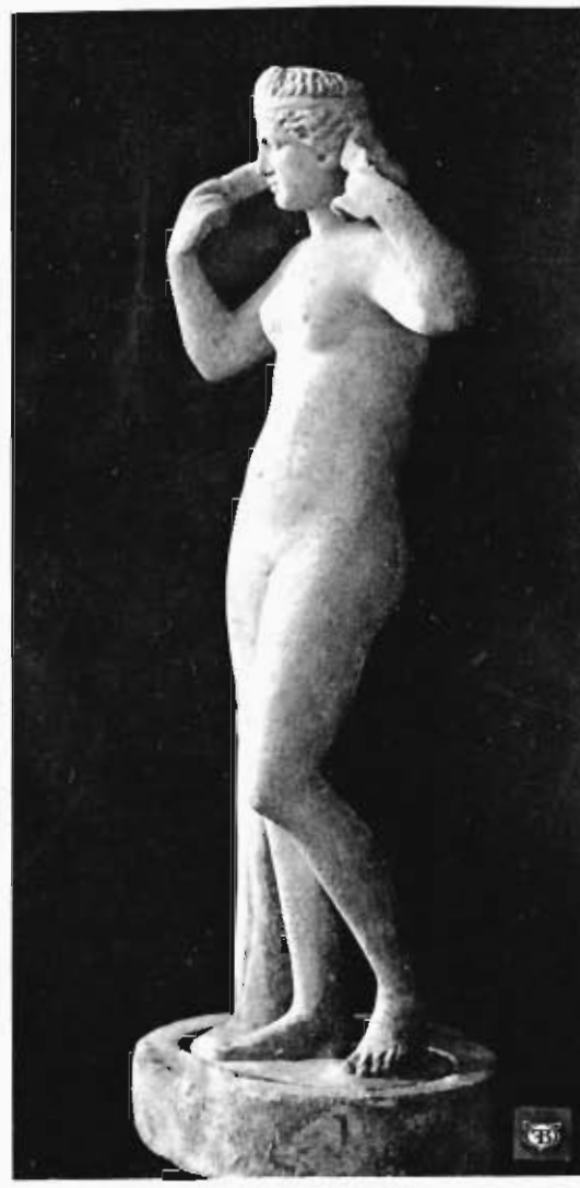
MARMORSTATUETTE DER APHRODITE AUS KYZIKOS SAMMLUNG NELIDOW IN ROM