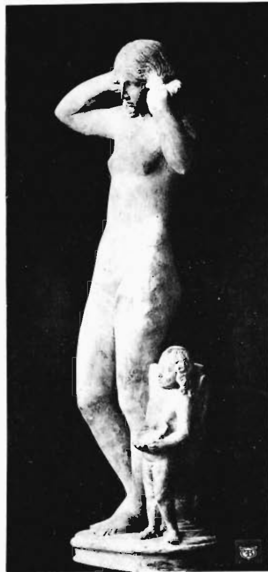
MARMORSTATUETTE DER APHRODITE SAMMLUNG PRINGSHEIM IN MÜNCHEN