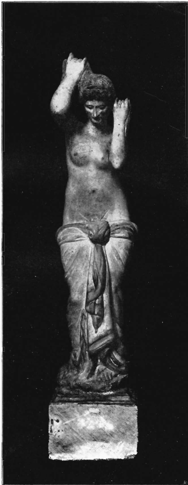
MARMORSTATUETTE DER APHRODITE AUS POMPEJI IN NEAPEL