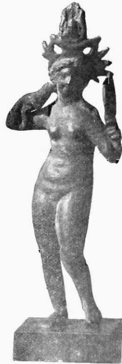
Bronzestatuetten im Kunsthandel. Figur 1.

vollen Formen bleiben die gleichen. Häufig trägt die Göttin in diesen Bronzestatuetten ein hohes Diadem in Gestalt spitzer Blätter, Palmetten oder Strahlen. Ein interessantes Beispiel, wo mit diesem Diademe noch der charakteristische ägyptische Kopfaufsatz der Isis verbunden ist, eine Bronzestatuetten in Privatbesitz geben wir beistehend in Figur 1. Es ist dies Stück wichtig als Bestätigung für die von uns bereits aus mehreren Anzeichen erschlossene Thatsache, dass dieser ganze Kreis von Aphroditebildungen recht eigentlich alexandrinischen Ursprungs und die Göttin die Isis-Aphrodite ist. So ist es denn auch das Gebiet alexandrinischer Kultur, aus dem die Statuetten dieser Art, deren Herkunft bekannt ist, zumeist stammen.