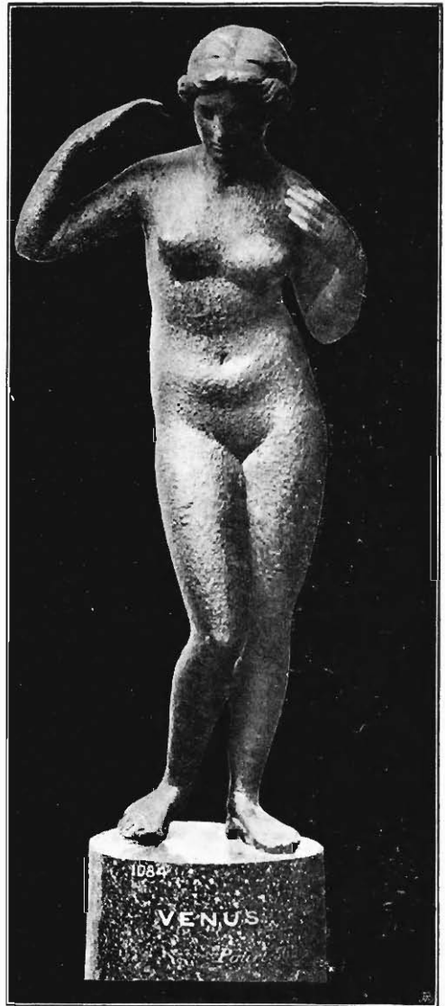
Bronzestatue der Aphrodite im British Museum (nach Walters, Catal. of the bronzes Figur 3.

Wieder andere Künstler hellenistischer Epoche, die ebenfalls Anstoss nahmen an dem Lockenausdrücken, wählten das Umlegen einer Binde um das Haupt, schlossen sich dann aber auch im ganzen Motiv mehr dem polykletischen Diadumenos an; sie wählten also rechtes Standbein und die Gesamthaltung wie an jenem berühmten Werke. So entstanden die zu Anfang von uns besprochenen Schöpfungen, die Statuette Nelidow und was wir oben an diese angeknüpft haben.