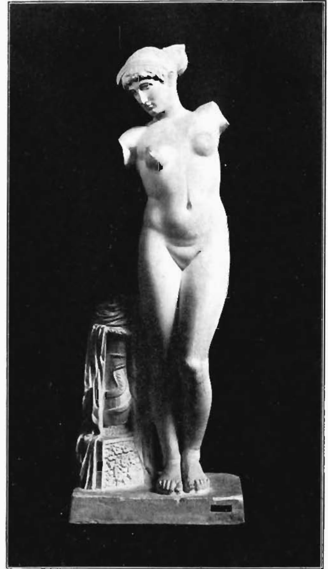
MARMORSTATUE DER APHRODITE IM CONSERVATORENPALAST ZU ROM