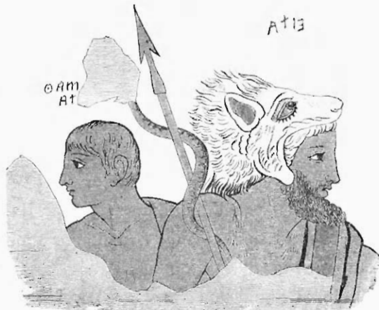
Hades mit ζωνή von dem Gemälde von Orvieto.

Polyb. 6, 22 λυκαία) eine ζωνή oder λυχή 124) tragen, so ist es sehr wahrscheinlich, dass man einer solchen Kopfbedeckung oder Bekleidung eine apotropäische 125) , den Gegner durch Zauber bannende oder erschreckende Wirkung zuschrieb 126) . Bekanntlich