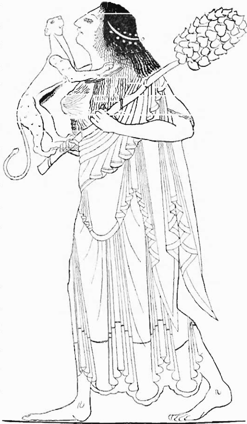
Mainade, einen jungen Panther liebkosend. Vasenbild (nach Mon. d. Inst. II. 27 = Roscher, Lex. d. Myth. 2, 2262.)

Aber nicht bloss aus dem klassischen Alterthum, sondern ebenso auch aus Mittelalter und Neuzeit lassen sich vereinzelt Fälle derartigen Wahnsinns — man könnte ihn mit einem allgemeinen Ausdruck Therianthropie 42b) nennen — nachweisen. So berichtet VINCENTIUS VON BEAUVAIS (im Speculum Sapientiae 15, 59 43) : Est et quaedam melancholiae species, quam qui patitur galli canisve similitudinem habere