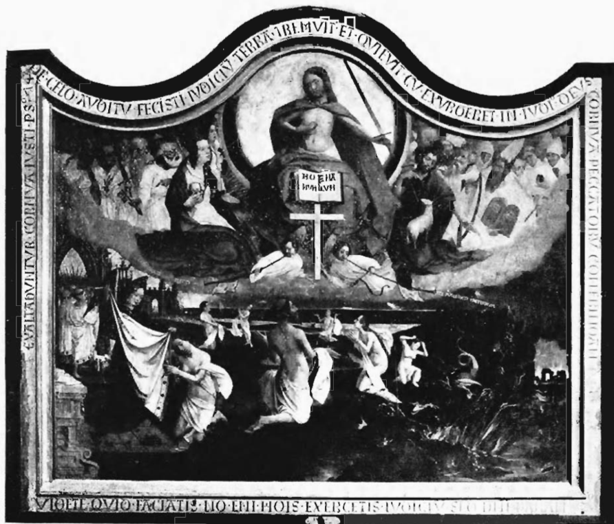
LE JUGEMENT DERNIER