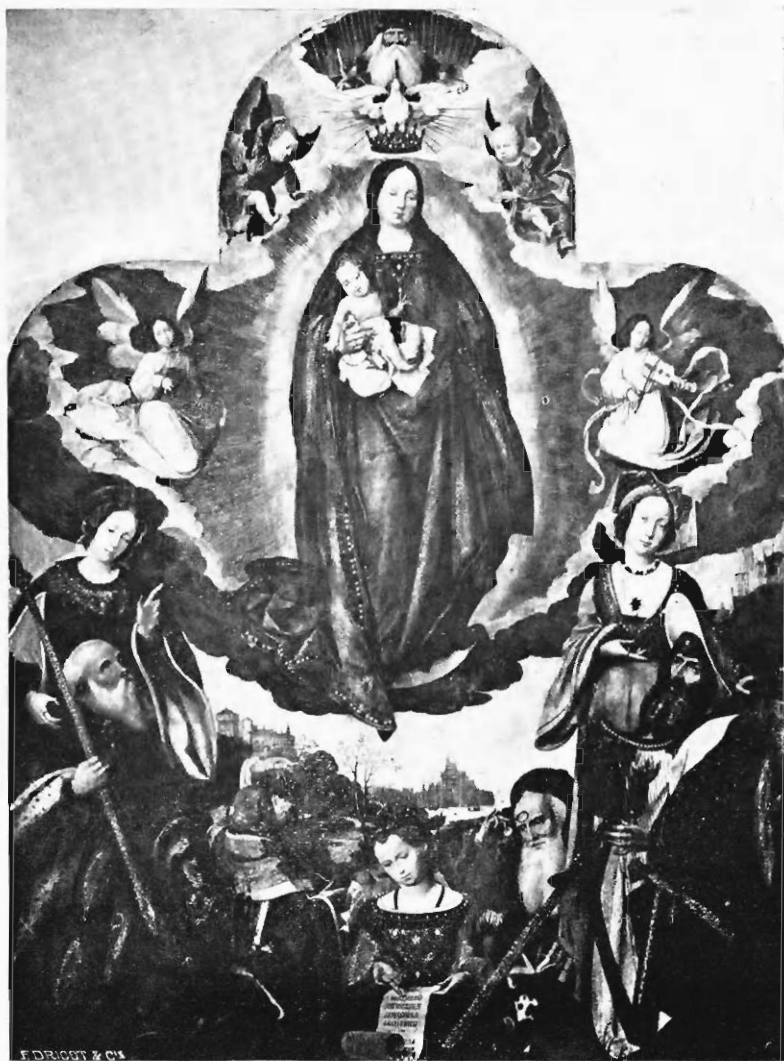
LA DEIPARA VIRGO, ANNONCÉE PAR LES PROPHÈTES ET LES SIBYLLES