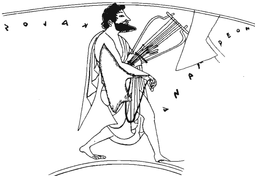
Fig. 18 Anakreon, aus einem Vasenbilde des britischen Museums.

singenden und Leier spielenden Mannes, der von heraneilenden Jünglingen enthusiastisch begrüßt wird, an Anakreon gedacht. Selbsterlebtes mag ihm die Anregung zu dem hübschen Bildchen gegeben haben; denn er hat ja den Dichter, der damals in Athen lebte, als die Vase entstand, gewiss gekannt. Die Figur stimmt merkwürdig mit der Statue des Louvre überein bis in die Haltung des