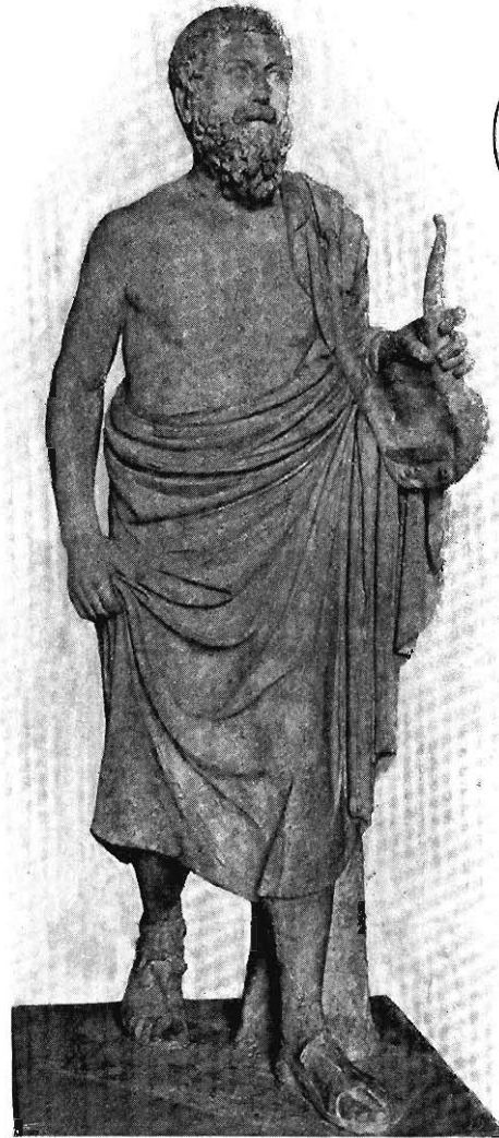
Fig. 13 Statue im Louvre.

Sie ist im Jahre 1885 in den Besitz des Louvre gelangt 3) und als n. 1894 in der Mitte der Salle du Tibre aufgestellt. Die am Postament angebrachte Beschriftung enthält die folgenden Angaben: „Autrefois à Sienne (coll. Pannilini). Marbre Grec. La tête et d'autres morceaux rapportés appartiennent à la statue. Restaurations: le bout du nez, un morceau de l'oreille gauche, de petits morceaux du cou, de petits éclats de la draperie, le bout des gros orteils, deux pièces en bas de la jambe gauche, une pièce au tronc d'arbre.“ Der Catalogue sommaire des marbres antiques verzeichnet die Figur unter n. 588 mit der Bemerkung „Poète grec à demi drapé, debout, tenant la lyre; statue d'une conservation remarquable. Coll. du sculpteur Dupré puis Palais Gori-Pannilini à Sienne“. Zu diesen Angaben kann ich nach freundlicher Mittheilung des Herrn de Villefosse noch hinzufügen, dass der Kopf, beide Füße, die Beine und Stücke der Basis gebrochen waren. „Le pied droit tient à la base, mais le pied gauche est simplement posé sur le sol sans y adhérer. Il y a une différence de travail entre les