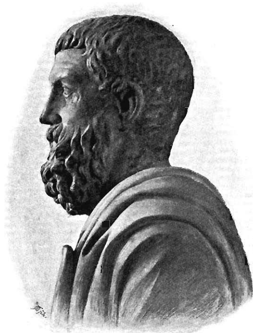
Fig. 16 Kopf der Statue Taf. I und Fig. 13.

Nicht ganz die gleiche Zurückhaltung aber, wie bei der Nachbildung des Körpers mit dem Gewande, scheint der Künstler bei der Wiedergabe des Kopfes (Taf. II; Fig. 16) geübt zu haben. Zwar tritt in den Grundzügen der strenge Typus des Vorbildes noch mit Entschiedenheit heraus. Dafür sind die Verhältnisse im ganzen, die Führung der Hauptlinien, die einfache Anlage des Haares und des Bartes bezeichnend. Das Gesamtbild in seinen wesentlichen Formen fügt sich wohl der Reihe langbärtiger Köpfe ein, die, etwa mit dem sogenannten Pherekydes beginnend, über den sitzenden Greis des Olympiagiebels und die Kentaurenköpfe namentlich der jüngeren unter