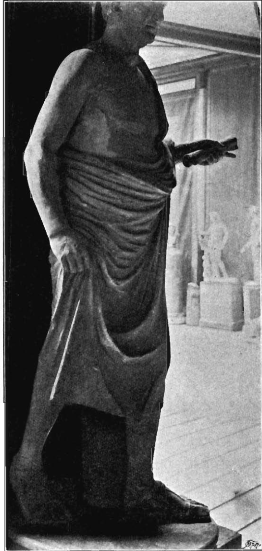
Fig. 15 Statue im Conservatorenpalast zu Rom.

Die Figur unterscheidet sich von der Pariser Statue durch die weniger sorgfältige und weniger charakteristische Ausführung. An den Sandalen sind die Ornamente weggelassen, an der Kappe über dem Spann ist statt der Palmetten, wie es scheint, ein breiter Rand von einer Innenfläche abgesetzt, die Beschläge an dem Spannriemen habe eine knappere, einem Epheublatte ähnliche Form. Die Falten des Mantels