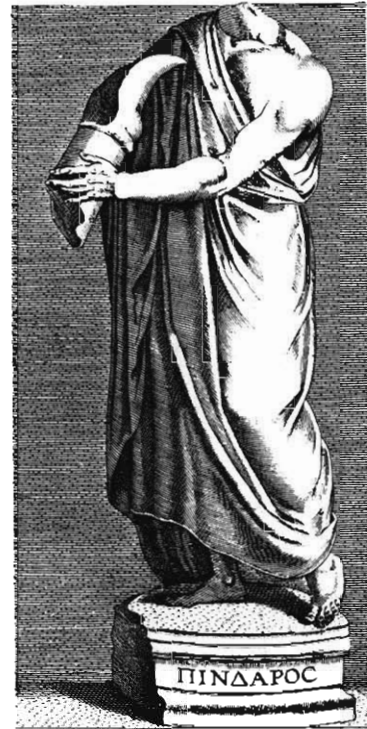
Fig. 19 Statue des Pindar.