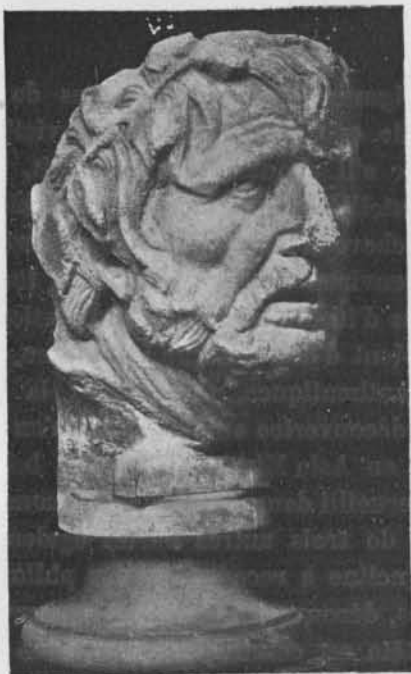
Fig. 1. — Tête du Musée de Thermes à Rome (Hekler, Portraits , p. 118 b)

définitivement ruinée, en 1813, par la découverte d'un hermès double de Socrate et de Sénèque, désignés par leurs noms, qui est aujourd'hui au Musée de Berlin (n° 391). Sénèque y est représenté, comme il fallait s'y attendre, sous les traits d'un