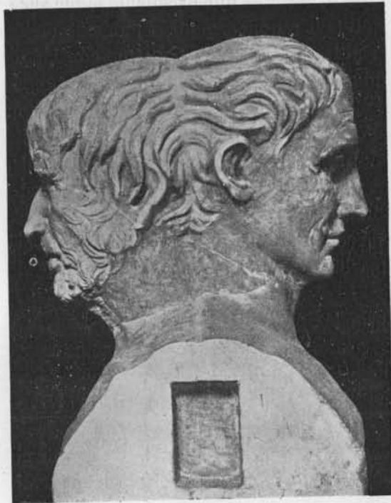
Fig. 2. — Hermès double. Villa Albani à Rome (Hekler, Portraits , p. 105).

Ces considérations permettent d'écartier les noms, mis en avant et parfois acceptés, de Callimaque, de Philéas, de Théo-