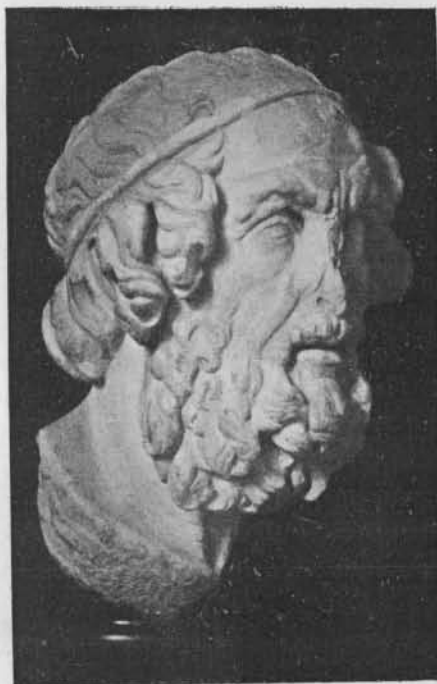
Fig. 4. — Homère. Musée de Boston (Hekler, Portraits , p. 118 a).

Furtwaengler songeait au poète des choliambes, Hipponax,