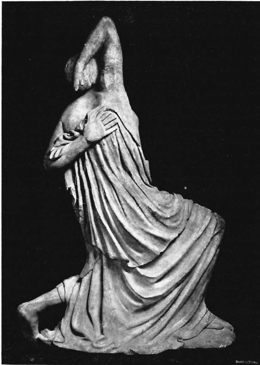
Statua di Niobide dagli Orti Sallustiani (Veduta del dorso)