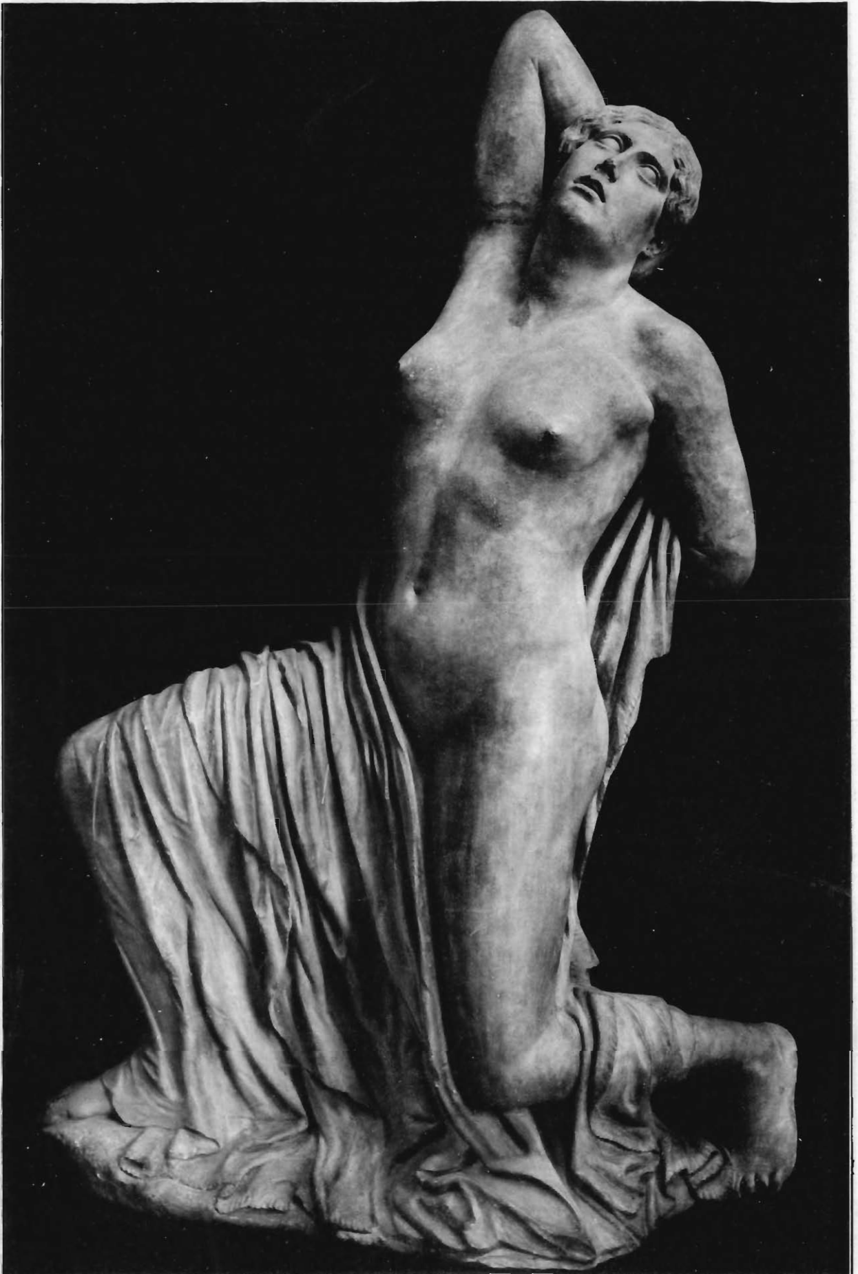
NIOBIDE DAGLI ORTI SALLVSTIANI