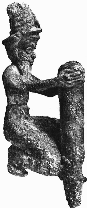
FIG. 7. — GÉNIE CHALDÉEN TENANT UN CLOU.

Cette rapide excursion à travers les monuments chaldéens du Louvre nous suggère deux réflexions pour conclure. La première est que nous devons beaucoup à ce monde oriental, qui tout d'abord semble si éloigné de nous et si étranger à nos mœurs. Nos origines sont gréco-latines, mais par-delà Rome et Athènes nous retrouvons l'Orient dans une foule de nos usages et de nos croyances. « C'est, en architecture, l'emploi de la brique, de la voûte, du cintre et de l'encorbellement, le décor en émail, en mosaïque, en haut-relief. C'est, en plastique, la création du génie ailé, du taureau à face humaine, du griffon, du Centaure et de Pégase. C'est, dans les arts industriels, la tapisserie, les broderies, les groupements héraldiques, source des armoiries et du blason... C'est enfin, dans le domaine de la science, l'astronomie. Si nous donnons encore aujourd'hui aux signes du Zodiaque et aux constellations les noms étranges que l'on sait, c'est aux Chaldéens que nous le devons; si nous comptons les jours de la semaine par sept et l'année par trois cent soixante-cinq jours, si nos paysans croient au mauvais sort, s'il y a encore des chiromanciens dans les villes, des devins et des sorcières dans les campagnes, des almanachs