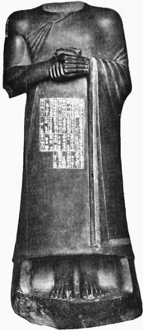
FIG. 3. — GOUDÉA, PATÉSI DE CHALDÉE. Statue en diorite.

aux grands patriarches et aux législateurs hébreux, Jacob, Joseph et Moïse. antérieure à toute la civilisation crétoise et mycénienne, antérieure de plus de mille ans à la guerre de Troie et à la formation du monde hellénique.