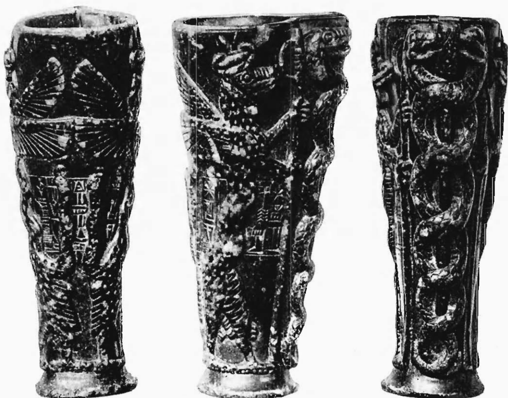
FIG. 4. — GOBELET DE GOUDÉA (VU SUR TROIS FACES). Stéatite.

brodé, et que le récit du songe prescrivant au patési d'élever un temple à son dieu, est gravé sur deux grands cylindres de terre cuite qui portent plus de 1300 cases d'écriture. Là encore on lit d'admirables pages, empreintes d'un lyrisme qui égale celui de la Bible et qui montrent comme elle l'homme conversant familièrement avec la divinité. « De nouveau,