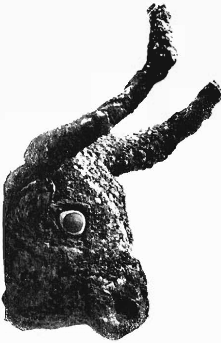
FIG. 6. — TÊTE DE VACHE AUX YEUX INCRUSTÉS DE LAPIS-LAZULI. Bronze.

couchés, porteuses de corbeilles, génies couronnés de tiaras cornues et tenant devant eux un grand clou symbolique planté en terre (fig. 7) 1 , enfin tout l'attirail des menus ex-voto qui complètent le mobilier religieux de ces anciens âges. On se sent dans un monde où la terreur de l'inconnu et de l'invisible a plus qu'ailleurs pesé sur l'homme, où l'idée du surnaturel occupe tous les moments de la vie. S'il en est resté