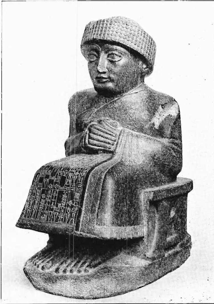
FIG. 2. — GOUDÉA, PATÉSI DE CHALDÉE. Statue en diorite.

» puissant ne causa [plus] aucun tort. Avec Nin-Ghirsou, Ourou-kaghina » fit ce pacte. »