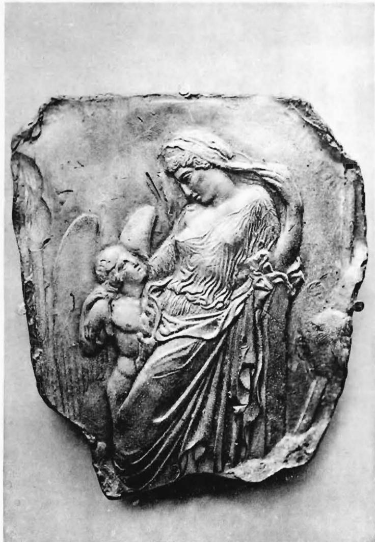
1. Aphrodite und Eros, Reliefform aus Athen.