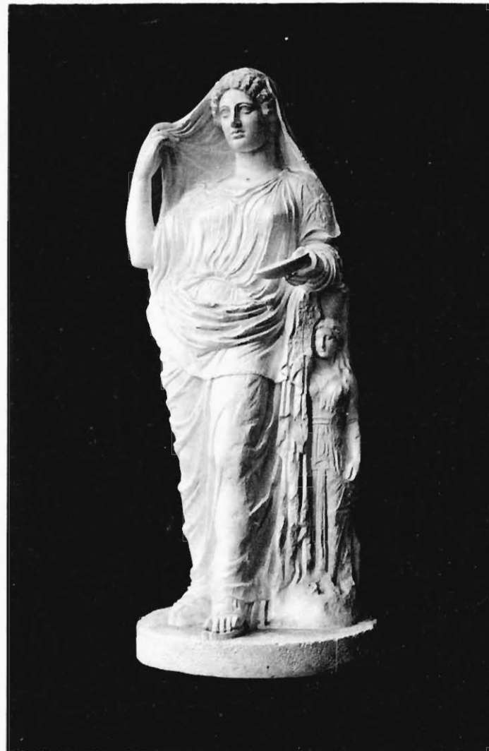
2. Aphrodite, Marmor aus Athen.