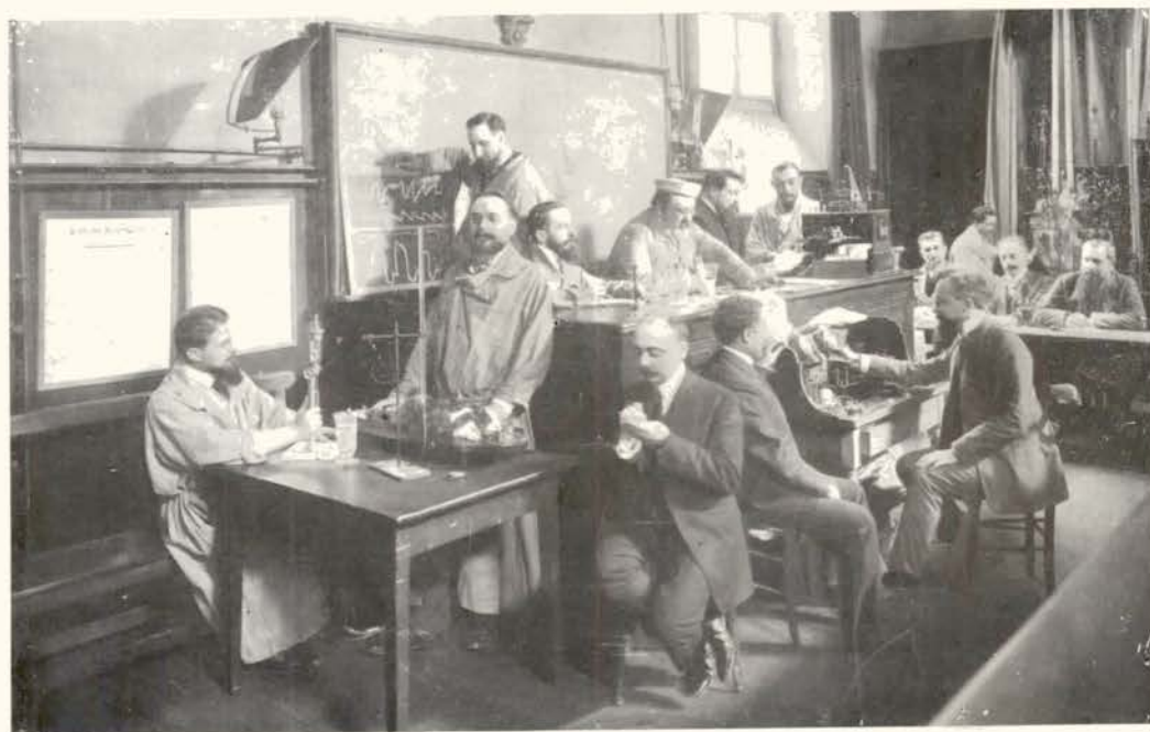
Clinique du Prof. Teissier. — Hôtel-Dieu en 1909.

Jules FROMENT inculqua à la chaire un sang nouveau par ses travaux importants sur la séméiologie nerveuse. Comme son maître BABINSKY, il sut tirer le maximum de résultats des symptômes fournis par l'examen attentif du malade. Depuis : l'homme debout, l'étude des aphasies, des causalgies, ses travaux furent multiples et féconds.