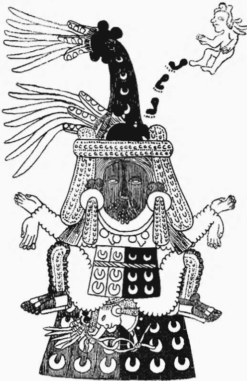
Abb. 1. Die altnexikanische Erntegöttin Teteoinnan gebiert am Sternhimmel die Maisgottheit. (Codex Borbonicus 13)

Während ich mich für die näheren Beweise auf frühere Schriften von mir 1) beziehen muß, will ich die ganz merkwürdige Idee des zwischen dem August-