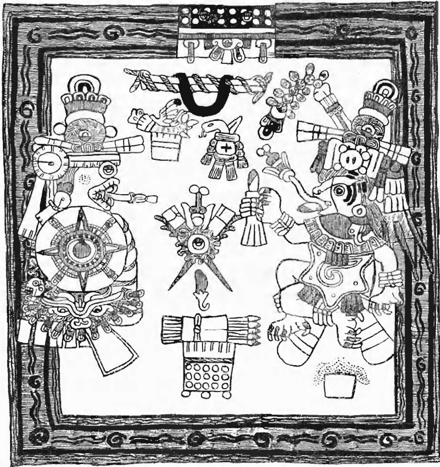
Abb. 7. Die Unterweltwasserfahrt des Sonnenfeuers. (Codex Borbonicus 16)

schlund im Westen, in den die Sonne versinkt. Rechts dieselbe Gottheit als aufgehende Sonne. Ein Opferrmesser und eine Blume kommen aus ihrem Rachen hervor. Ein zweites Opferrmesser hält ihre Hand. Es bedeutet den an den Sternen vollzogenen Opfertod (s. K. I). Die Blume weist auf den Frühling hin, der in den Liedern an die Götter durch die bloße Wendung 'die