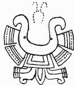
Abb. 4. In der Nasenscheidewand getragener Goldschmuck, yacametzli (= Nasenmond) in Gestalt eines Schmetterlings. Gefunden in der Stadt Mexiko.

Fallen die geschweiften Enden, wie es namentlich beim 'Nasenmond' oft vorkommt, fort, so haben wir die Form auf dem Kleide der Göttin (Abb. 1). Die Gestalt ist aber nicht aus der Nachahmung eines Halbmondes entstanden, sondern ist, wie aus der Betrachtung von Abb. 4 klar wird und ich früher 1) ausführlich nachgewiesen habe, aus der Zeichnung eines Schmetterlings reduziert. In Abb. 4 sind nämlich noch der Schwanz und die Flügel deutlich gekennzeichnet und den schon fortgefallenen, aber in ähnlichen Schmetterlingsdarstellungen noch vorhandenen 2) Kopf mit den Fühlern habe ich durch Punktierung angedeutet. Der Schmetterling ist aber die Hieroglyphe für Feuer.