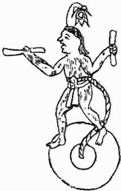
Abb. 6. Der Frühlingsgott Xipe, als Stern auf dem durchlochten Stein ( temalacatl ), dem Ort des Sonnenaufgangs, kämpfend. (E. Boban, Catalogue de la collection E. Goupil, Paris 1801, Atlas 49)

Das Wasser ( atl ) als Abbild der Morgenröte hat durch den Kampf der Sonne mit den Sternen die Bedeutung 'Krieg' im Mexikanischen erhalten. Auch in den Vereinigten Staaten habe ich die Morgenröte und die Abendröte als Wasser mehrfach nachgewiesen. 1) Daneben kommt auch beides als Wasser und Feuer dort vor, und daß dieses in Mexiko ebenfalls der Fall war, sieht man unter anderem aus der Phrase 'Wasser-Feuer' ( atl tlachinollí ) = Krieg. So verstehen wir sehr gut in unserem Xipe-Liede das Aufgehen der Sonne als Geburt des Kriegshäuptlings. Das Seltsamste aber ist, daß man in der Tat, wie der aztekische Kommentar zu Vers 2 berichtet, den Regen von der Morgenröte erwartete. Deshalb kommt allenthalben von der Sonne zugleich der Regen.