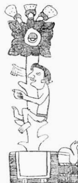
Abb. 8. Das Schicksal der Toten. Wanderung durch die Unterwelt zu den Gestirnen. (Aubinsches Tonalamatl S. 10)

Von äußerster Wichtigkeit erscheint mir für das Erkennen von ursprünglichen Sonnenschicksalen das Gesetz, das wir an dem Kronos-Zeus- und Herodes-Christus-Mythus kennen gelernt haben und das sich in dem Zusammentreffen folgender Umstände ausspricht: die Furcht, daß der Neugeborene später den Herrscher töte und sich an seine Stelle setze, der Versuch, das Kind zu beseitigen, seine wunderbare Rettung womöglich unter Vernichtung der Altersgenossen und das Eintreffen der ersten Befürchtung. Das sehen wir so recht am Mosesmythus. Da haben wir die Furcht der Ägypter vor den Hebräern, den Befehl, alle männliche Nachkommenschaft zu töten, Moses' wunderbare Rettung (als Stern), der als aufgehende Sonne die Ägypter (die Sterne) tatsächlich vernichtet, als sie ihm und seinen Volksgenossen durch das Meer der Morgenröte nacheilen wollen. Moses kommt natürlich hindurch, die Sterne aber werden durch diese alte Waffe der Sonne vernichtet. Und selbst für eine solche Verfolgung der Sonne durch die Unterweltsgeister auf ihrer unterirdischen Fahrt bis zum Sonnenaufgang gibt es in Amerika ein sehr schönes Beispiel 2) , so daß die Erklärung des Auszuges aus Ägypten als unterirdische Sonnenfahrt gesichert erscheint.