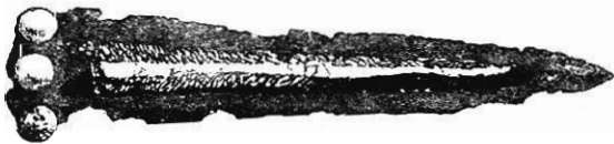
FIG. 1. — Poignard de Vaphio.

( Ἐφημερίς , pl. 7). Le premier (n° 1, notre fig. 1) est un poignard triangulaire en bronze, long de 0 m ,215; trois clous d'or, qui subsis-