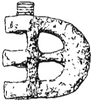
FIG. 2. — Hache en bronze de Vaphio.

ne saurait tenir lieu du croquis que nous en donnons ici. Comme l'a fait remarquer M. Belger (1), cette forme de hache permet de comprendre le passage de l' Odyssée , où il est question de douze haches alignées, au travers desquelles Ulysse fait passer une flèche ( Odyss. , XXI, 120 et suiv.). — Un couteau en bronze (fig. 9) présente une disposition curieuse : la feuille de métal a été recourbée à sa base pour former la douille où s'insérerait le manche, et les bords de la feuille sont dentelés. Des couteaux en bronze d'un type analogue ont été découverts à Courtauvant (Aube) et à Saint-Ilgen (duché de Bade). — On ne sait trop comment expliquer de grandes cuillers de bronze (fig. 10, 10 a), munies d'une douille fixée à la coupelle par trois clous; ce