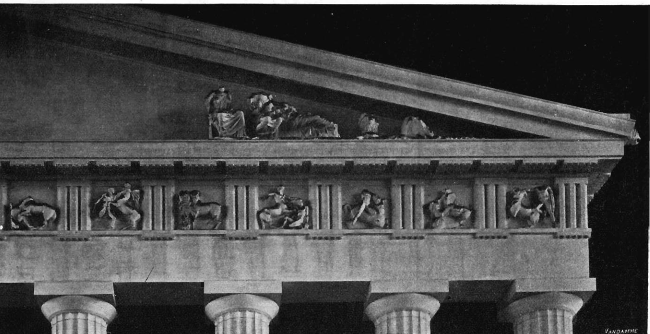
PRÈS LE MOULAGE DU MUSÉE DU CINQUANTENAIRE