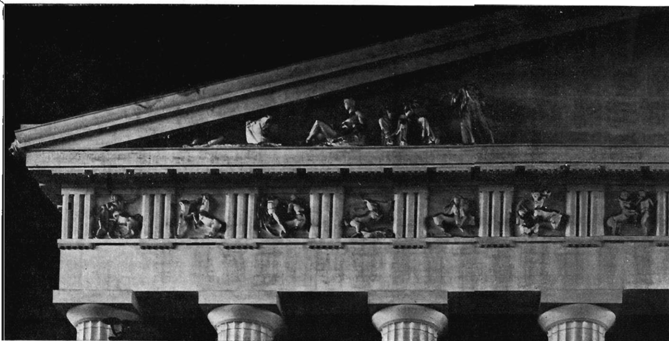
FIG. 1. — LE FRONTON ORIENTAL DU PARTHÉNON D'ATHÈNES