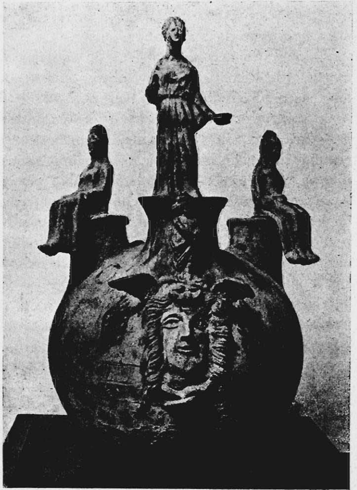
RYC. 4. ASKOS N. 137 W MUZ. XX. CZARTORYSKICH.

nie przez zanurzenie naczynia w roztworze, lecz przez posmarowanie go pendzlem. Bezpośrednio na tym gruncie są kładzione farby sproszkowane, rozmieszane w wodzie, do której dodano jakąś ingrediencją spajającą. Nastąpiło to dopiero po wypaleniu. Barwy bowiem nie uległy chemicz-