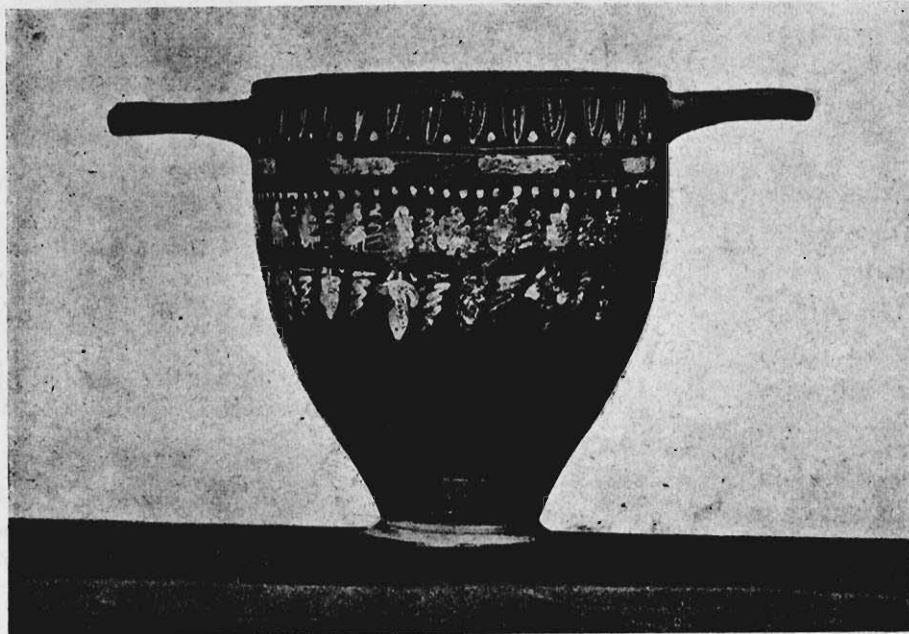
RYC. 2. SKIFOS W GAB. ARCH. KLASS. U. J.

To samo możemy stwierdzić na drugim naczyniu krakowskim (ryc. 2), które jest w naszych zbiorach jedynym przedstawicielem czarno pokostowanych waz hellenistycznych, zdobnych pstry-