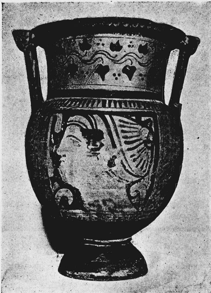
RYC. 1. KRATER W GAB. ARCH. KLASS. U. J.