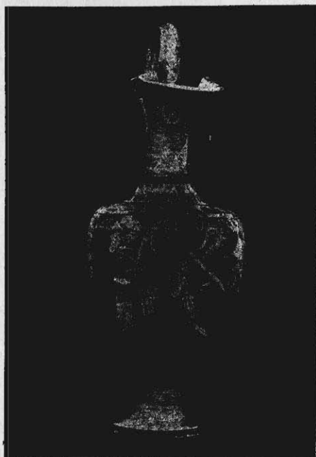
RYC. 3. OINOCHOE W MUZ. XX. CZARTORYSKICH.

kami nawiązują do odwiecznych zwyczajów greckich, tak samo główni reprezentanci białogrun- towanej ceramiki hellenistycznej, to jest naczynia malowane z Canosy i innych południowo włos- kich fabryk, są poprostu zwyrodnieniem takichże waz attyckich i wiążą się z nimi łańcuchem prawie nieprzerwanym 1) . A mianowicie skoro minęła moda białych lecyt z czarnymi figurami, potem pięknych białych czasz attyckich już to z figurami czarno zarysowanymi, już to polichro- mowanych, wreszcie białych lecyt mogilnych, — można było obawiać się, że także technika grun- towania obrazków na białym tle naczynia z nimi zstąpiła do grobu. Zdawałoby się, że właśnie kruchość pobiała przyczyniła się do tego. Tymczasem nie. W epoce późniejszych djadochów