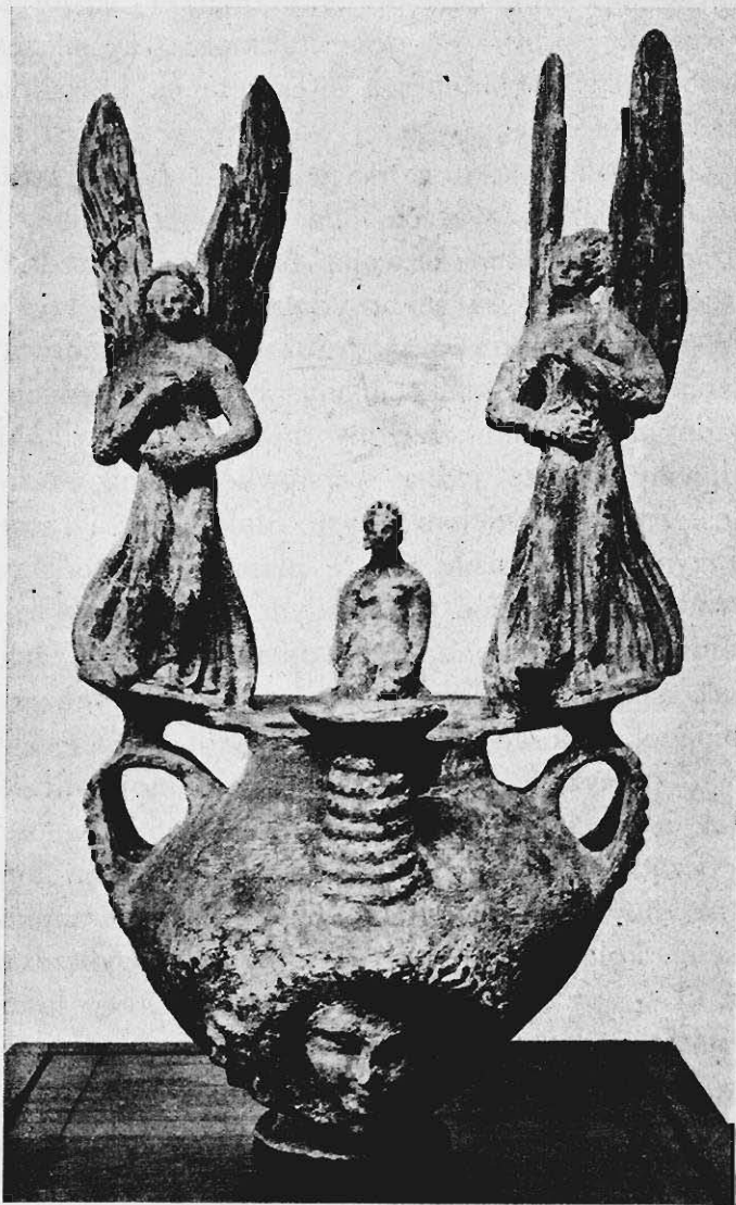
RYC. 5. ASKOS N. 138 W MUZ. XX. CZARTORYSKICH.

Takie samo znaczenie i przeznaczenie miał drugi askos n. 138 (ryc. 5) w tem samym Muzeum Wys. (do szczytu figurek) 0·51; samo naczynie wys. 0·20; szer. wraz z uchami 0·25 m. Lej, tudzież oba pierścienie wszystkich trzech uch są karbowane. W środku każdego z czterech odcinków, na które grzbiet naczynia się rozpada, wielka, okrągła, dość płaska brodawka. Stopa naczynia nieproporcjonalnie mała i wątła. Tuż nad nią od frontu maska młodocianej Meduzy t. z. pięknego typu, z włosami na podobieństwo grzywy ocieniającymi delikatną twarz, pod której brodą są dwa węże zaplecione. Twarz maski wraz z lewym pasmem włosów, prawa postać skrzydlata, twarz kobiety siedzącej na krawędzi naczynia, prawe skrzydło lewej figurki, tudzież jej prawe przedramię, wreszcie prawe ramię prawej figurki i drobne cząstki draperji były niegdyś odłamane i są dzisiaj zlepione. Środkowa figurka jest bardzo dobrze posadzona. Przedstawia kobietę całkiem nagą z zwisającymi do wnętrza askosu nogami. Ramiona jej oparte na udach. Jej ciało młode, lecz głowa, zdobna skromnym warkoczykiem, tudzież djademem i kolczykami podług-